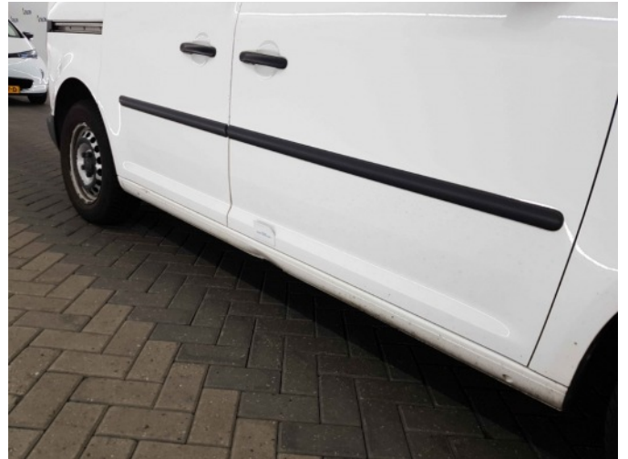
1. Dorpel - rechts