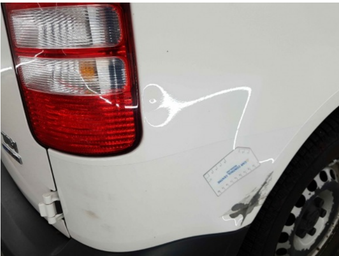
2. Zijwand - achter - rechts