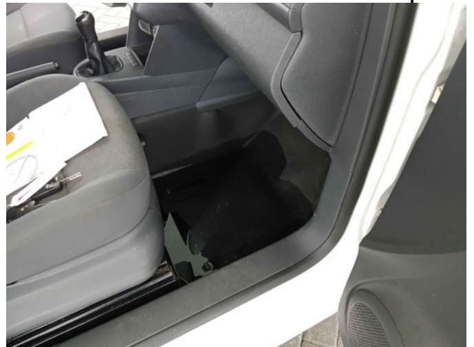
3. Watertank lek, interieur vol water