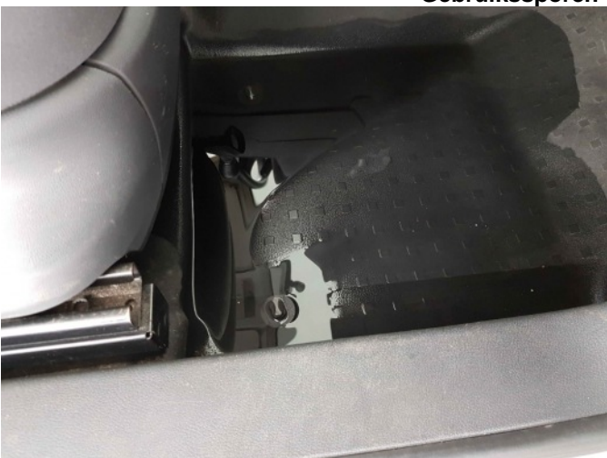
3. Watertank lek, interieur vol water