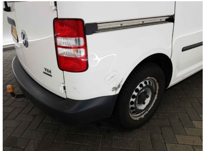
2. Zijwand - achter - rechts