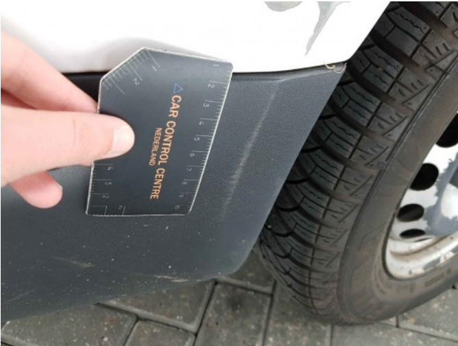
2. Zijwand - achter - rechts