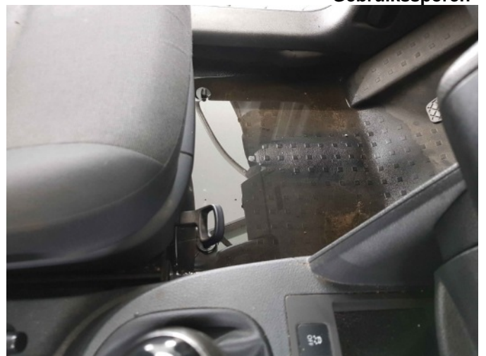
3. Watertank lek, interieur vol water