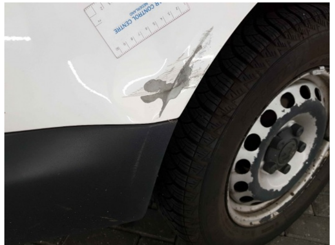
2. Zijwand - achter - rechts