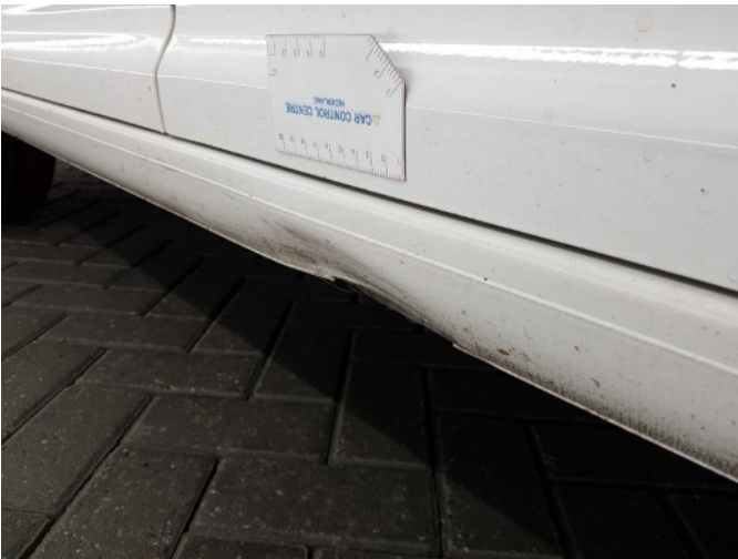
1. Dorpel - rechts