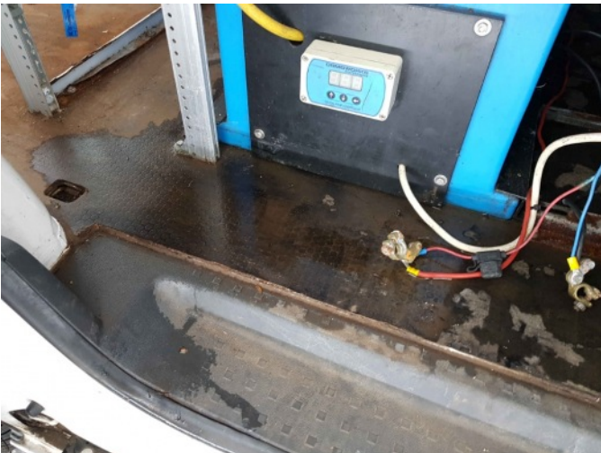
3. Watertank lek, interieur vol water