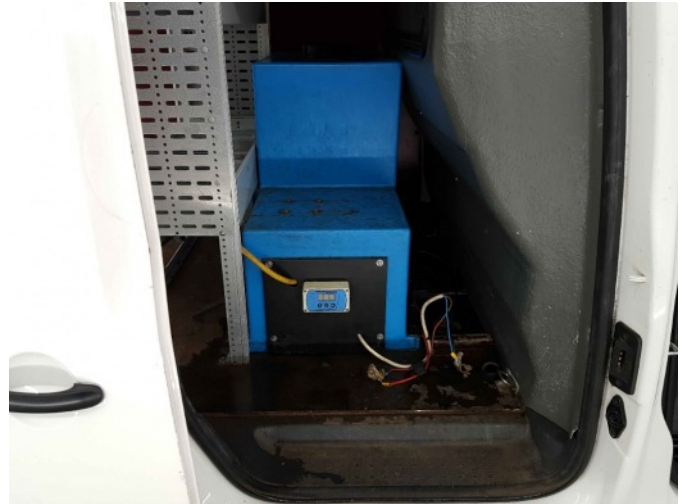
3. Watertank lek, interieur vol water