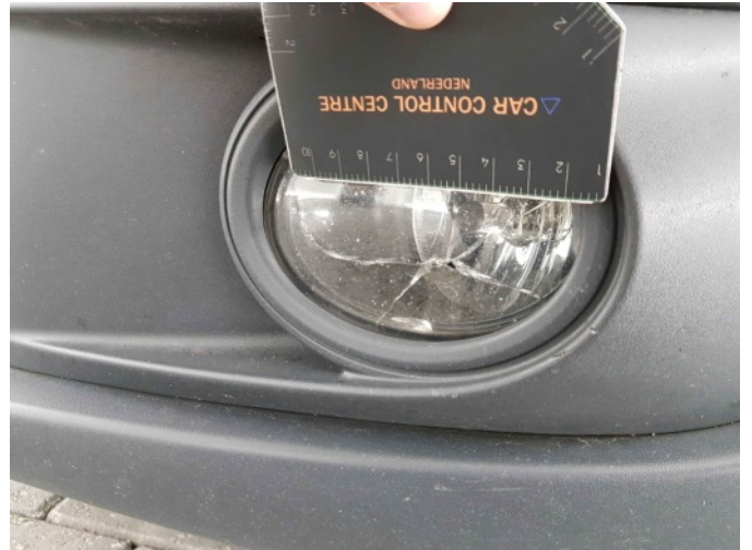
5. LV mistlamp