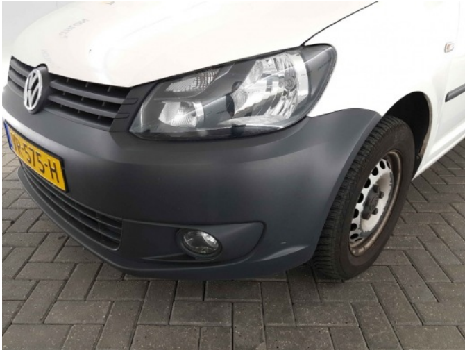
5. LV mistlamp