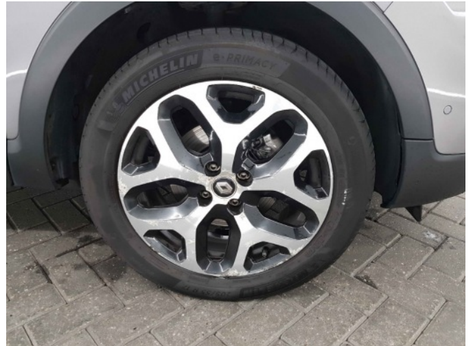
1. Velg voor - rechts