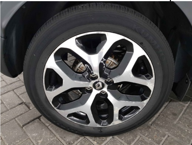
1. Velg voor - rechts