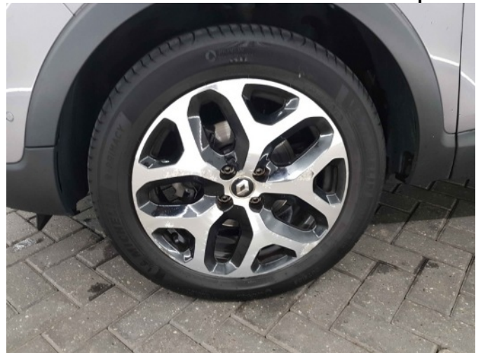
1. Velg voor - rechts