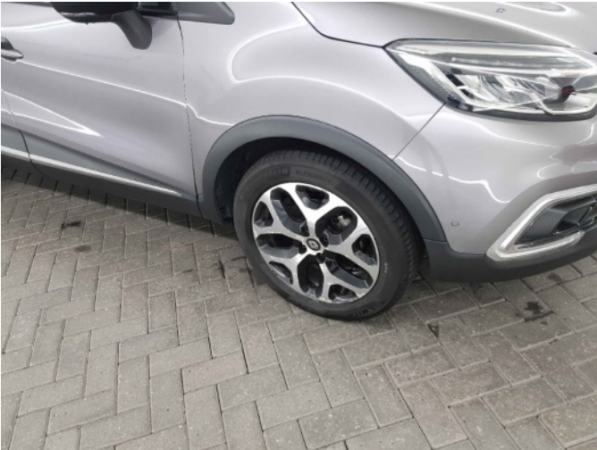
1. Velg voor - rechts