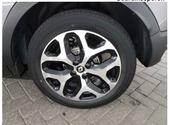
1. Velg voor - rechts