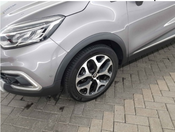
1. Velg voor - rechts