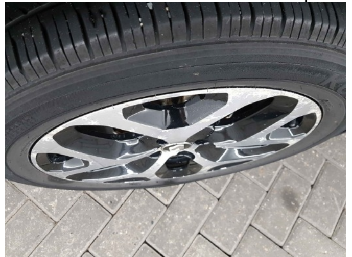
1. Velg voor - rechts