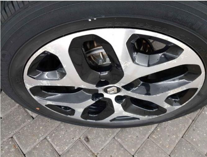
1. Velg voor - rechts