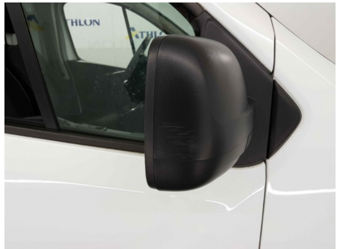
2. Spiegelbehuizing - rechts