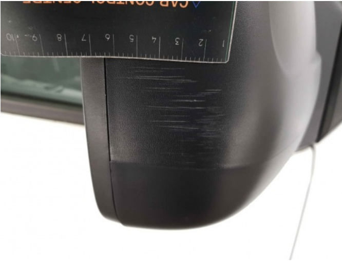
2. Spiegelbehuizing - rechts