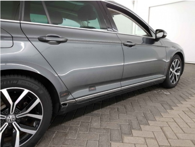
3. Dorpel - rechts