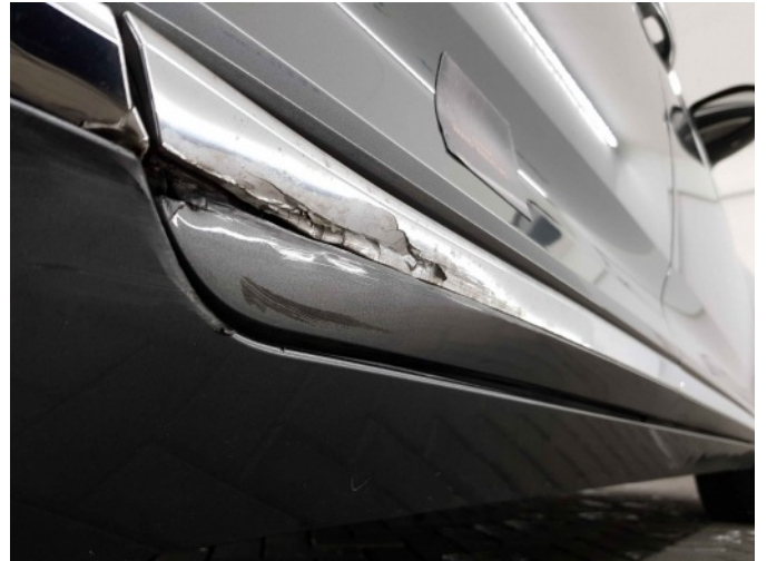
3. Dorpel - rechts