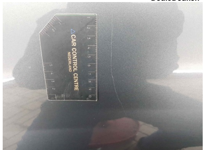
4. Portier achter - rechts