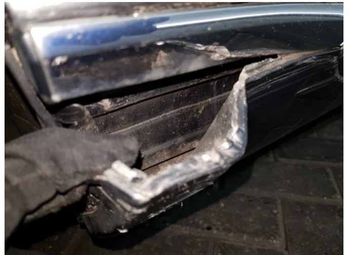
3. Dorpel - rechts