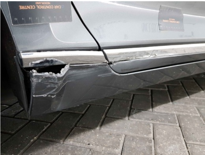
3. Dorpel - rechts