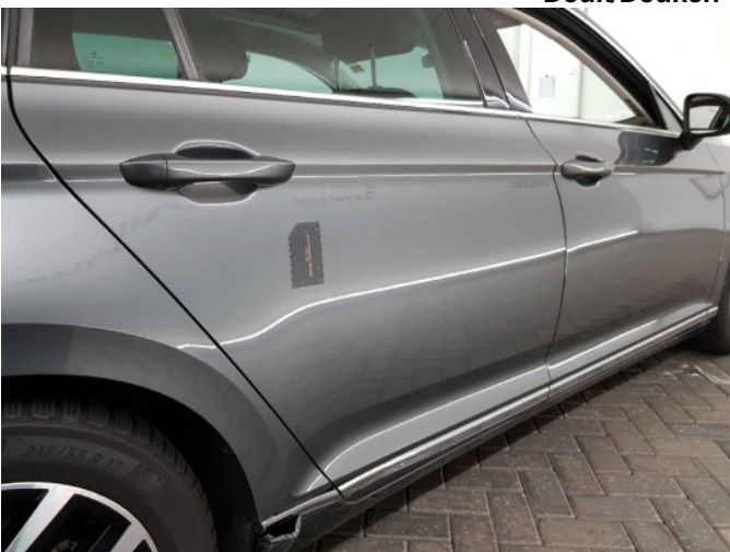
4. Portier achter - rechts