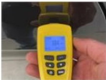
Carrosserie, Lakdiktemeting, Controleren