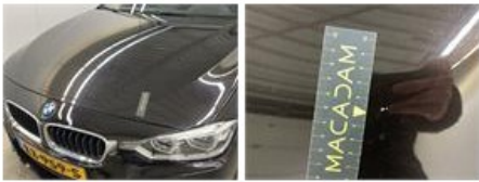
Scherm A L, Kras(sen), Herstellen en spuiten (compleet)