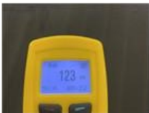
Onderhoud, Onderhoud, Uitvoeren