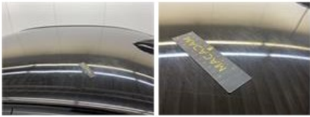
Deur A L, Kras(sen), Herstellen en spuiten (gedeeltelijk)