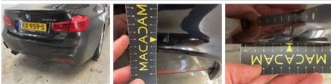
Scherm A R, Hersteld, Controleren