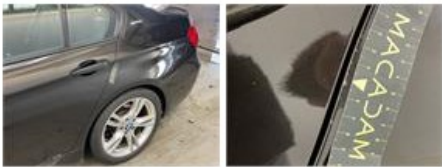
Deur V R, Hersteld, Controleren