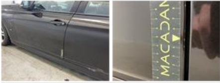
Deur A R, Hersteld, Controleren