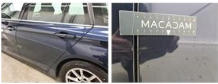
Deur V L, Kras(sen), Herstellen en spuiten (compleet)