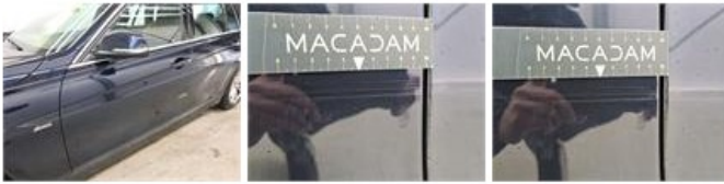
Carrosserie, Lakdiktemeting, Aanvaardbaar