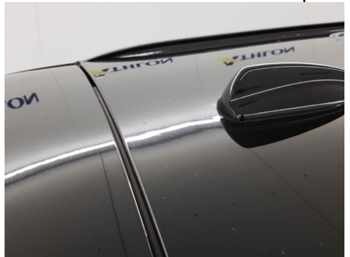
2. Slecht herstel