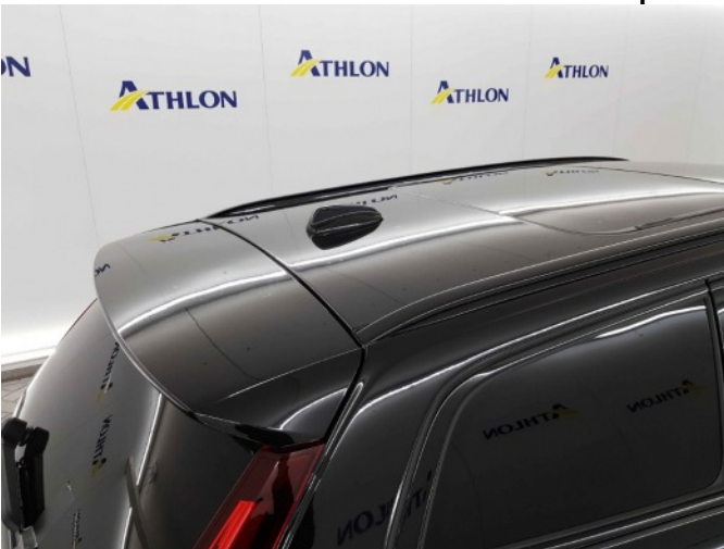
2. Slecht herstel