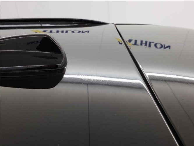
2. Slecht herstel