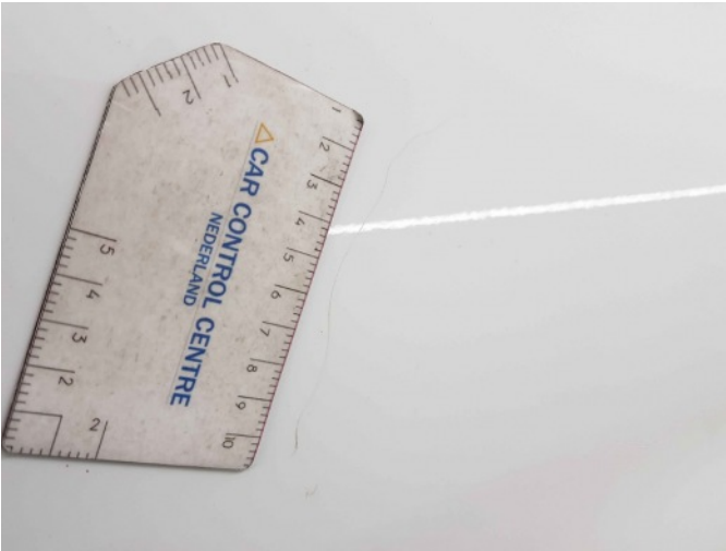
1. Portier achter - rechts