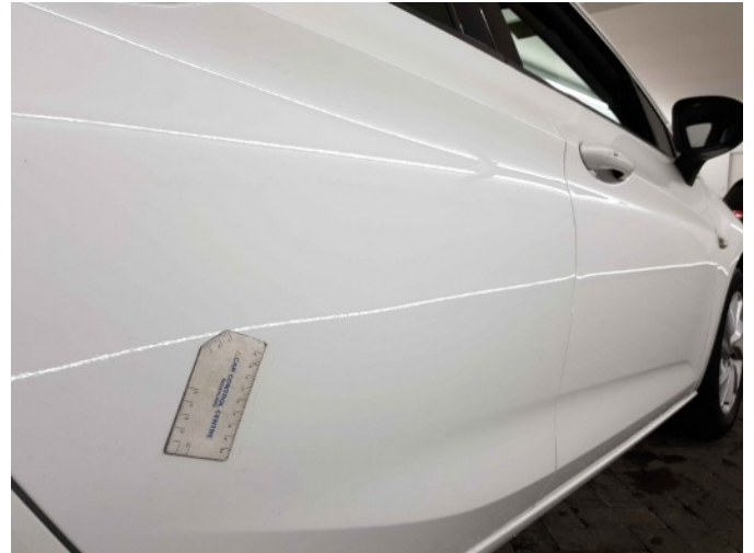
1. Portier achter - rechts