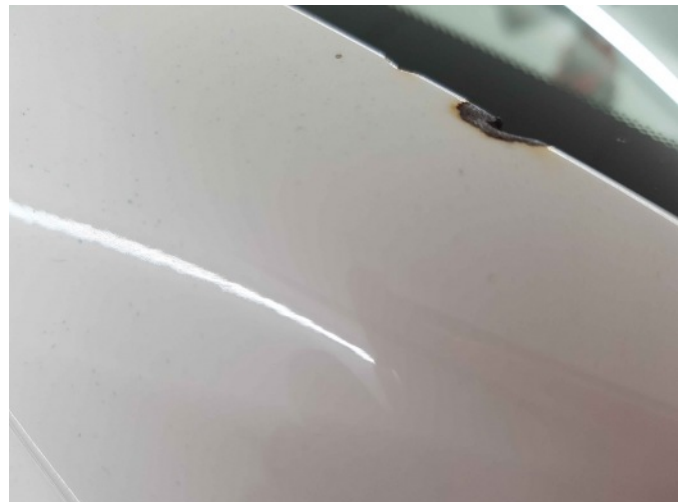
2. A-stijl voor - rechts