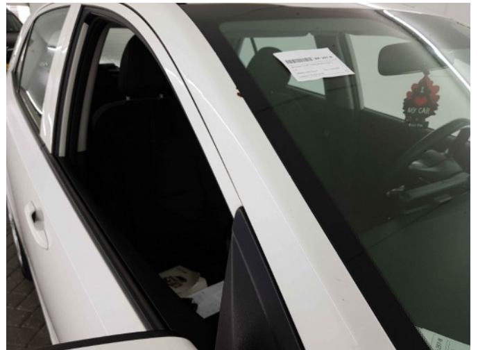
2. A-stijl voor - rechts