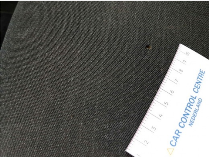
4. Linker voorstoel