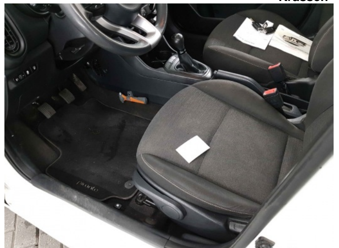
4. Linker voorstoel