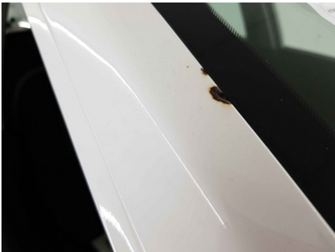
2. A-stijl voor - rechts