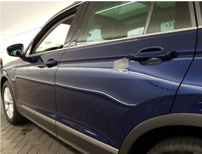
1. Portier achter - links