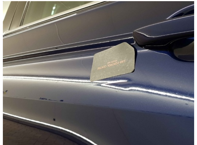
1. Portier achter - links