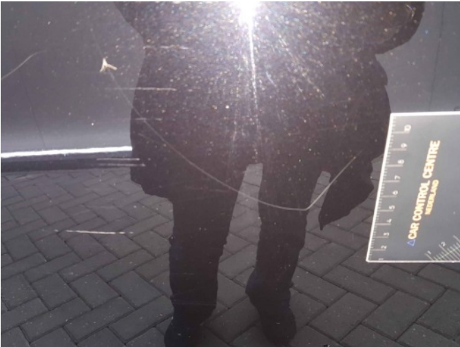
3. Portier achter - rechts