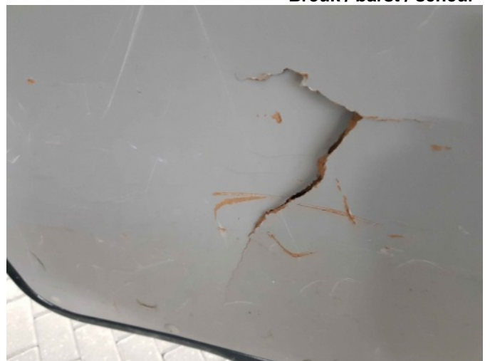
7. Bekleding achterklep