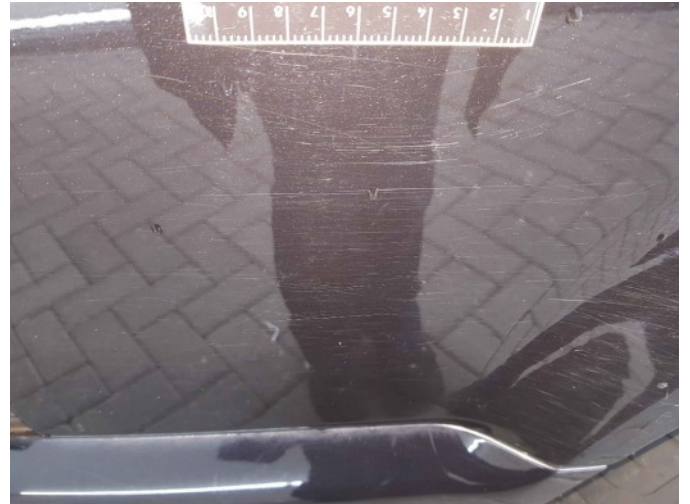
3. Portier achter - rechts