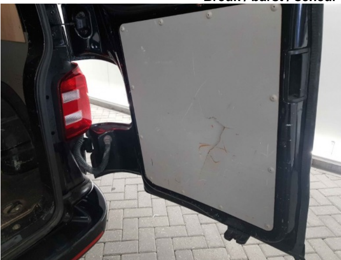
7. Bekleding achterklep