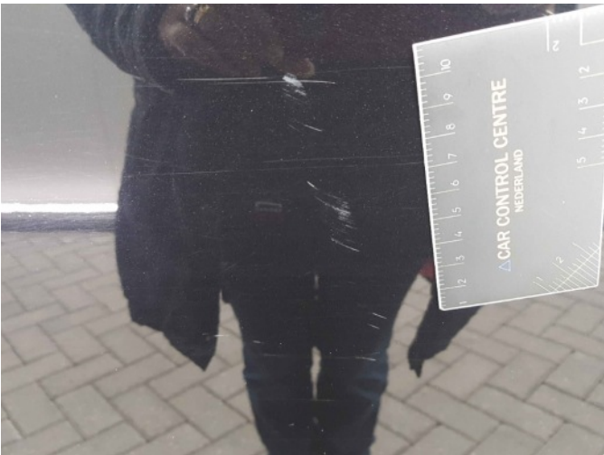
3. Portier achter - rechts