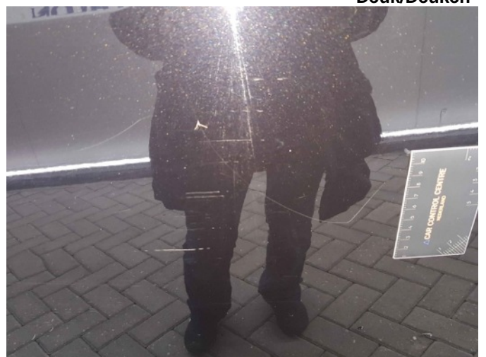
3. Portier achter - rechts