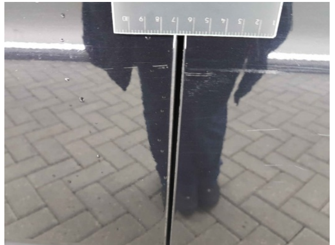
3. Portier achter - rechts