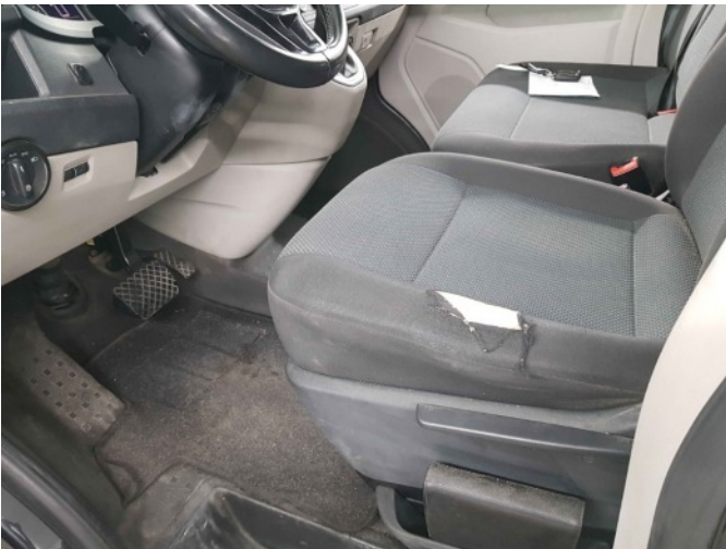
6. Linker voorstoel