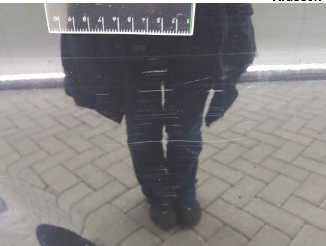
3. Portier achter - rechts