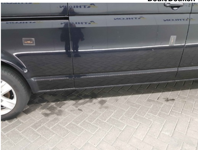
3. Portier achter - rechts