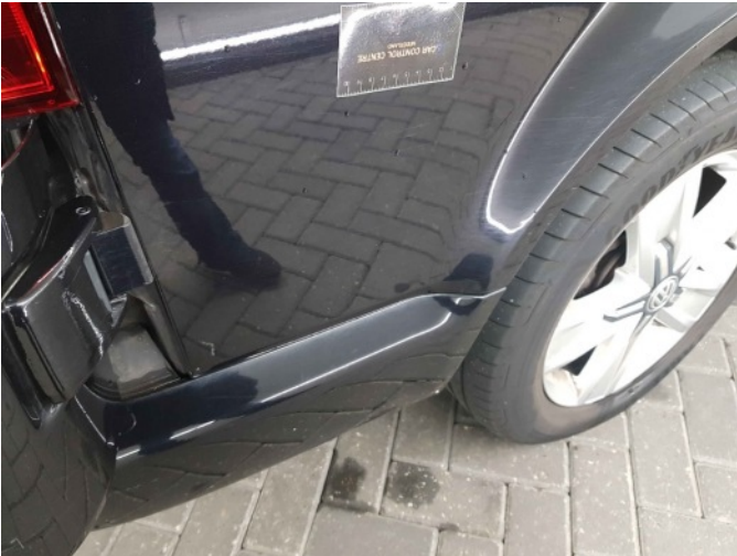
3. Portier achter - rechts