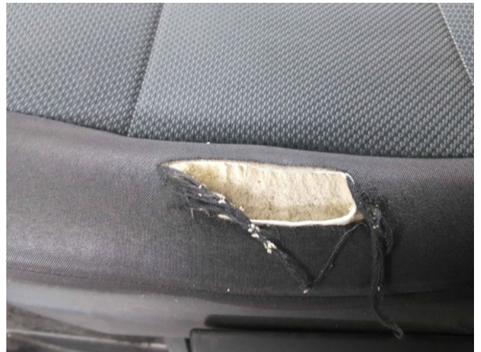
6. Linker voorstoel