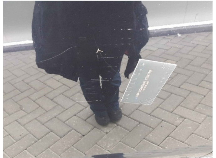
3. Portier achter - rechts