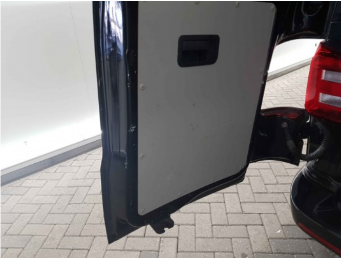
7. Bekleding achterklep