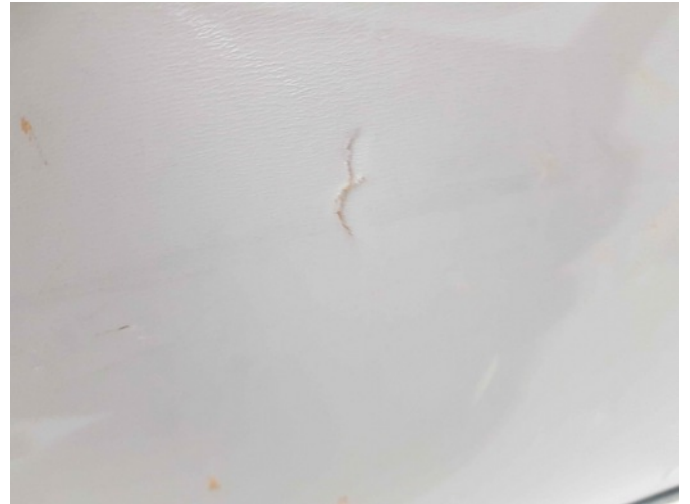
7. Bekleding achterklep