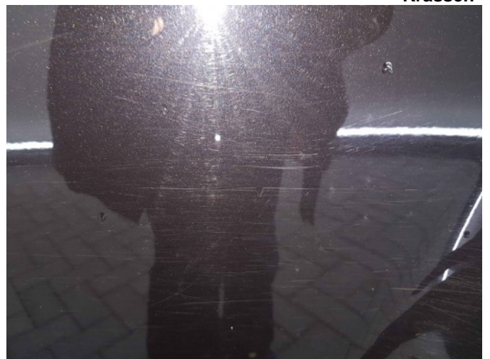
3. Portier achter - rechts