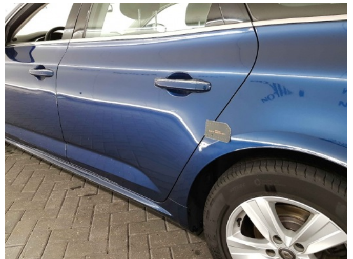
1. Zijwand - achter - Links