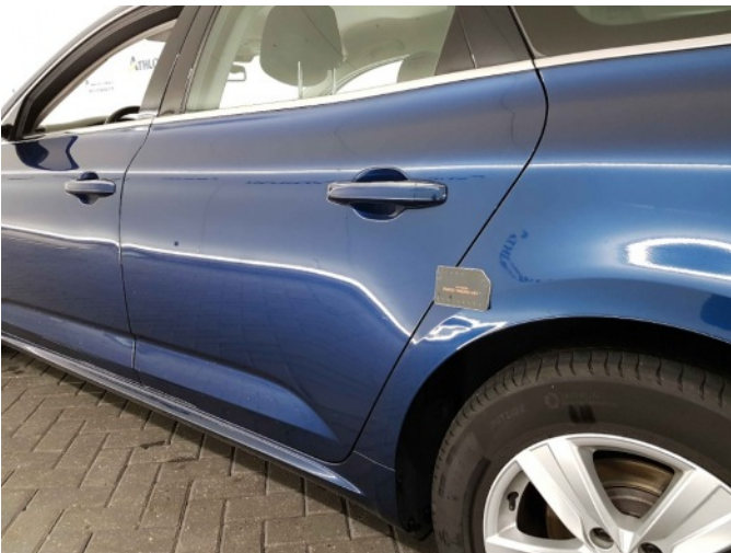
1. Zijwand - achter - Links