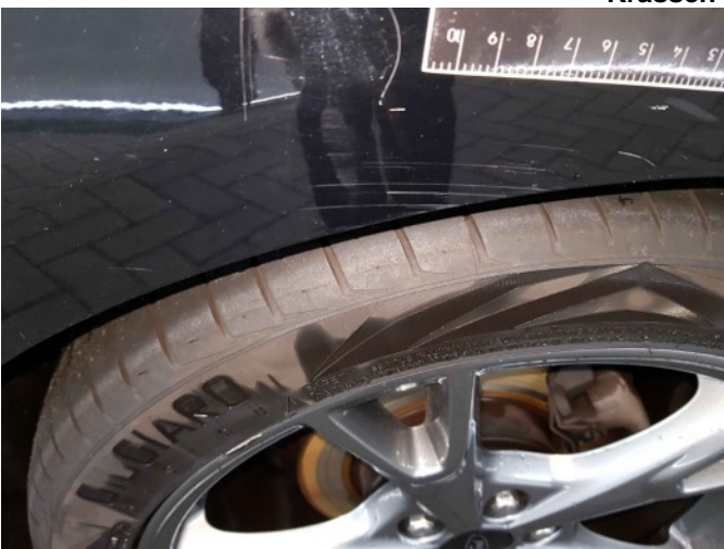
3. Zijwand - achter - Links