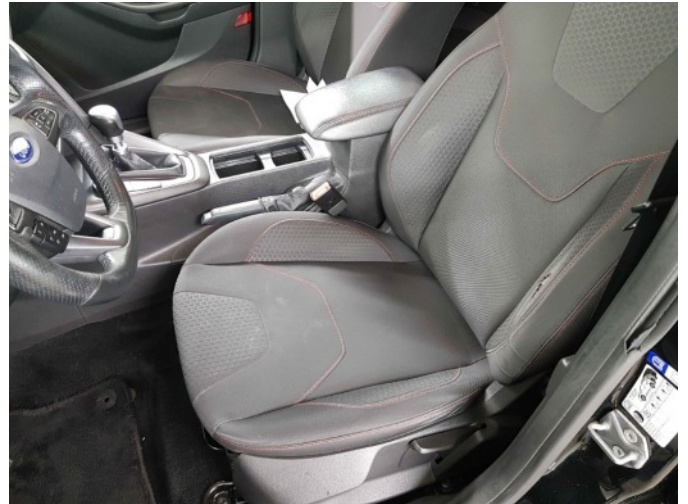
5. Binnenzijde interieur