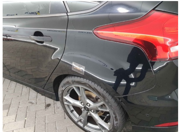
3. Zijwand - achter - Links