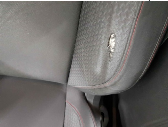
5. Binnenzijde interieur