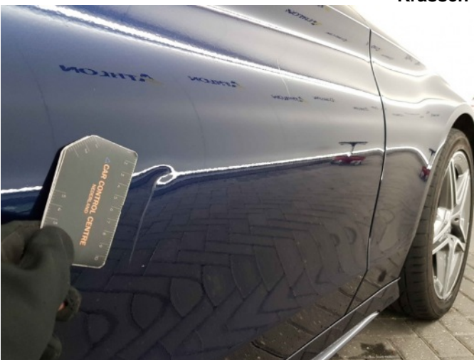
3. Portier voor - rechts