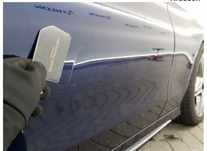
3. Portier voor - rechts