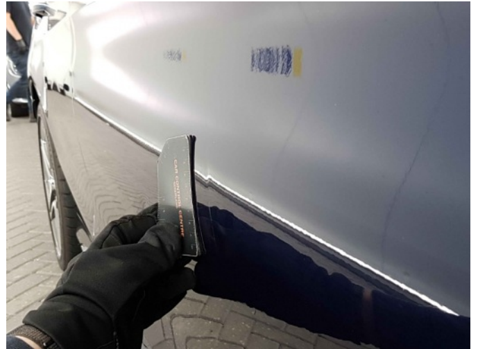
3. Portier voor - rechts