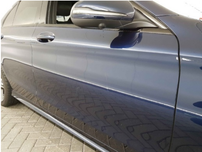
3. Portier voor - rechts