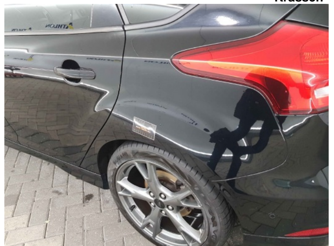
3. Zijwand - achter - Links