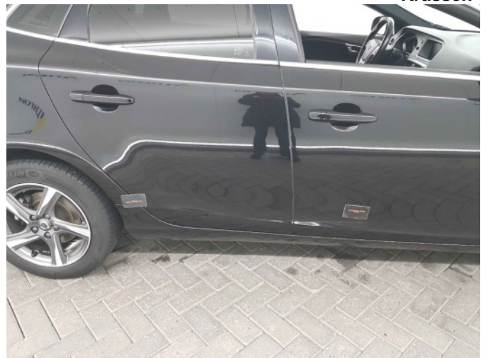
2. Portier voor - rechts