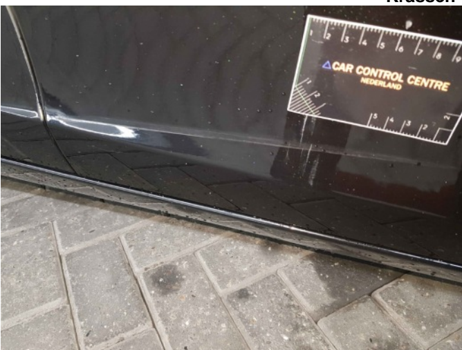
2. Portier voor - rechts