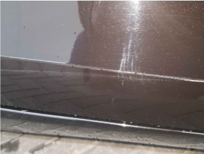
2. Portier voor - rechts