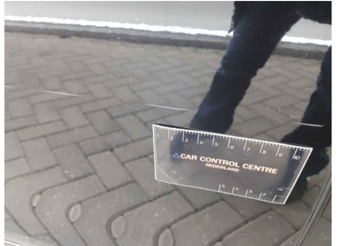
2. Portier voor - rechts