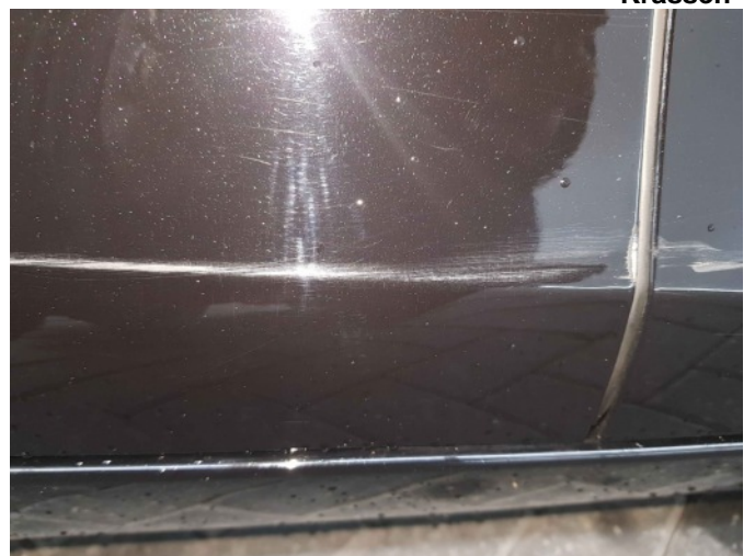
2. Portier voor - rechts