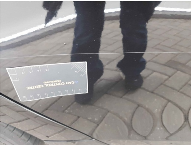
2. Portier voor - rechts