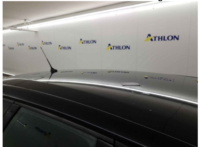
4. Ingevreten vogelpoep Dak, MK