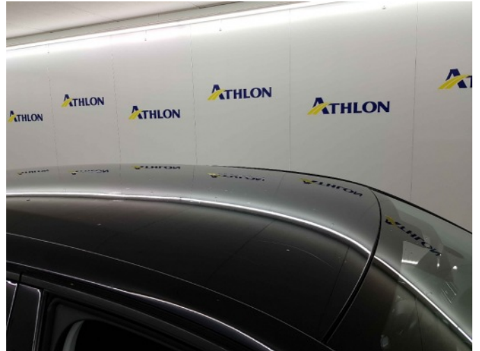
3. Dak 40x20mm