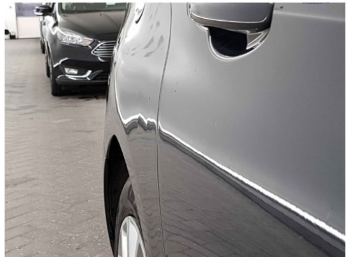
1. Zijwand - achter - rechts