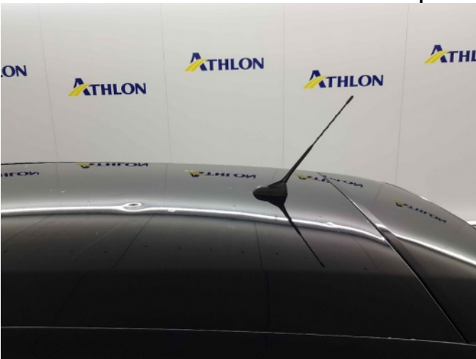
3. Dak 40x20mm