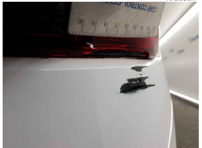
2. Achterlicht rechts