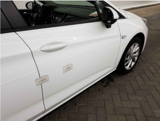
1. Portier voor - rechts