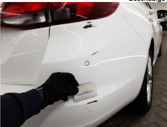
2. Achterlicht rechts