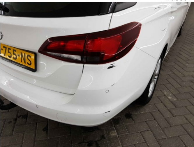
2. Achterlicht rechts