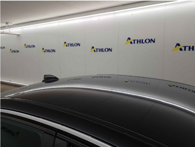
4. Dak 5x20mm