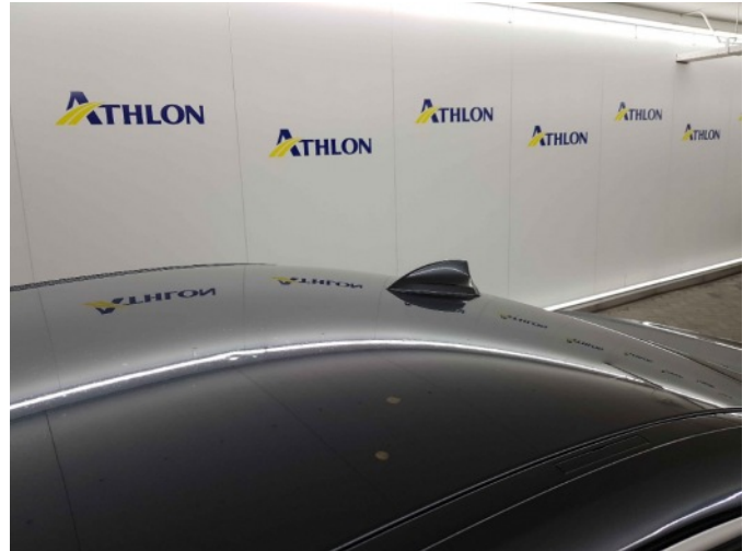
4. Dak 5x20mm