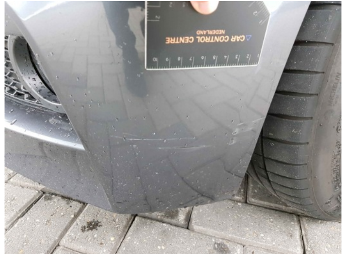
2. Spatbord voor- links