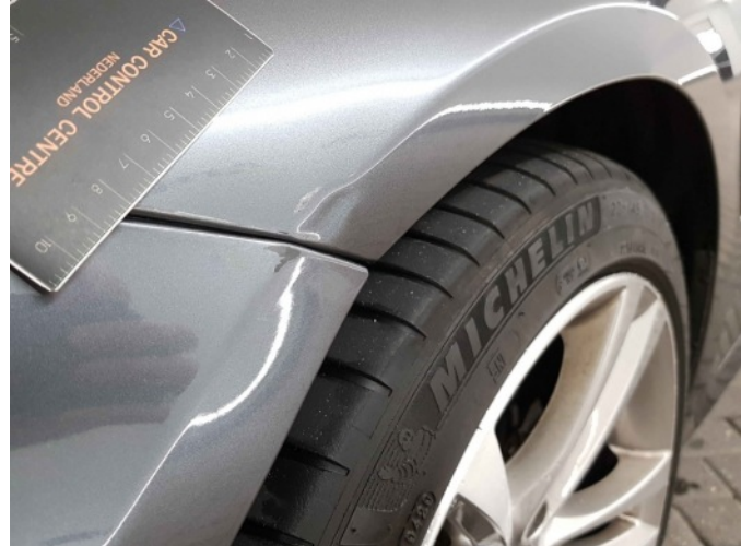
2. Spatbord voor- links