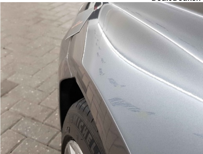
2. Spatbord voor- links