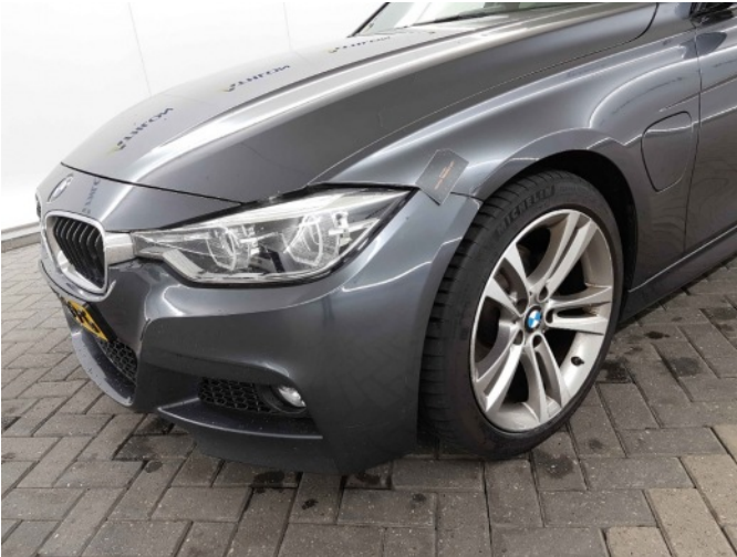
2. Spatbord voor- links