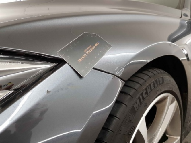
2. Spatbord voor- links