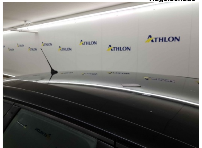
3. Ingevreten vogelpoep Dak, MK