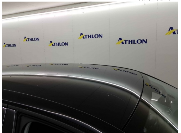
2. Dak 40x20mm