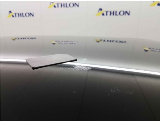
3. Ingevreten vogelpoep Dak, MK