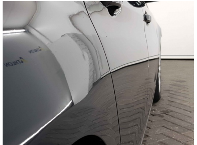
1. Zijwand - achter - rechts