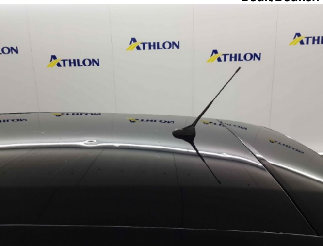
2. Dak 40x20mm