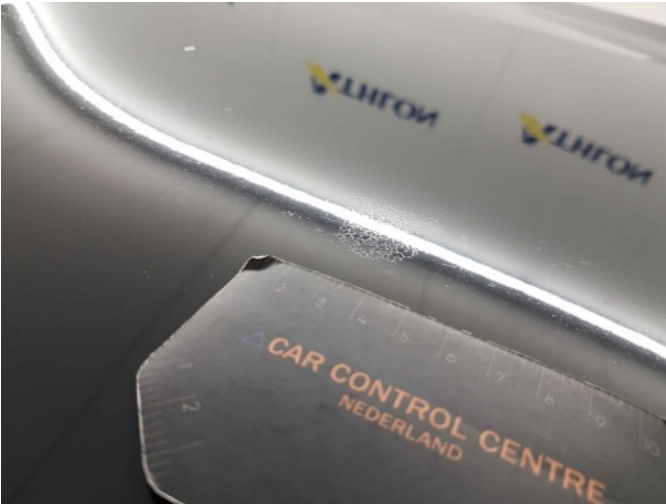
3. Ingevreten vogelpoep Dak, MK