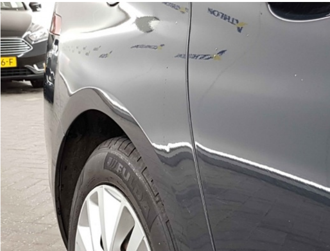
1. Zijwand - achter - rechts