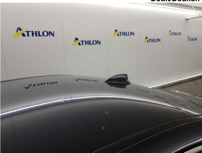
4. Dak 5x20mm