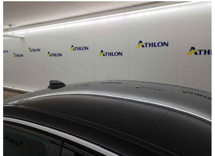
4. Dak 5x20mm