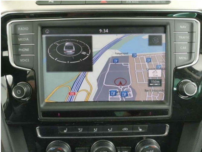
Navigatie of radio