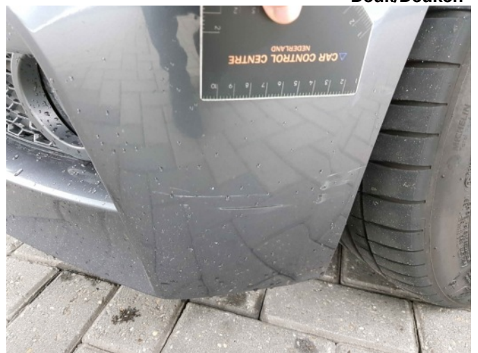
2. Spatbord voor- links