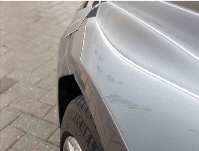
2. Spatbord voor- links