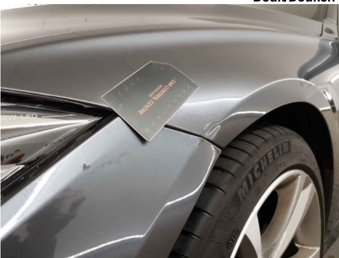
2. Spatbord voor- links