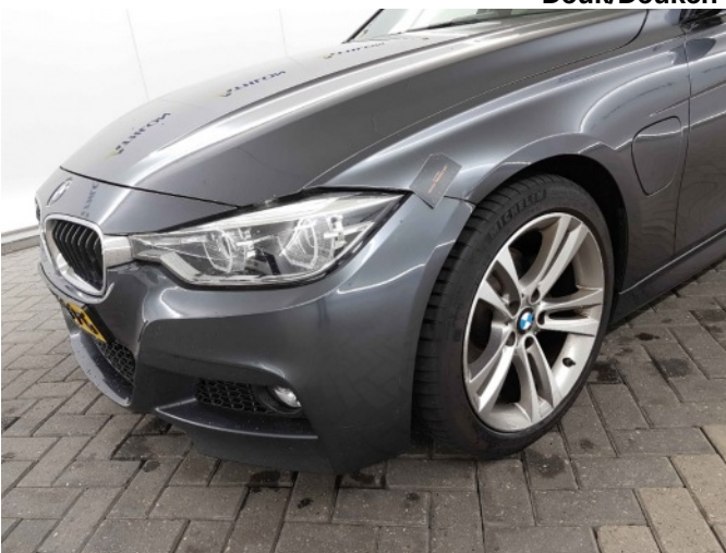
2. Spatbord voor- links