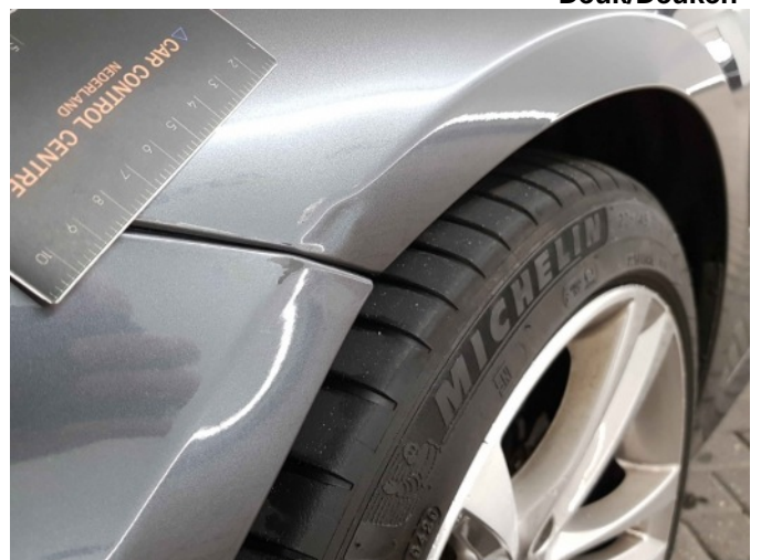
2. Spatbord voor- links