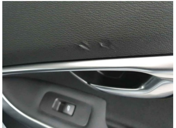
1. Bekleding / beklede panelen