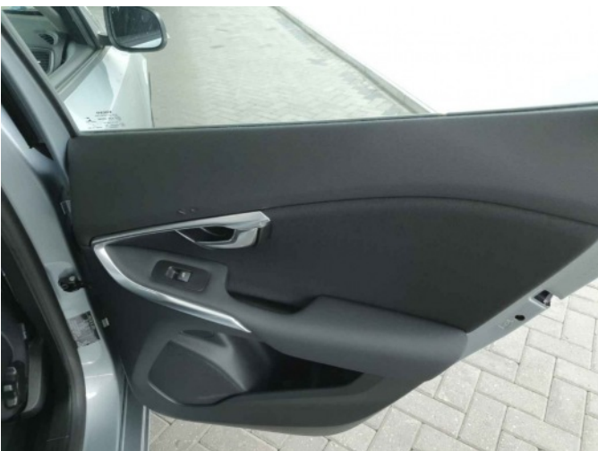
1. Bekleding / beklede panelen