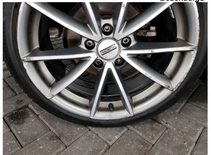
5. Velg achter - links