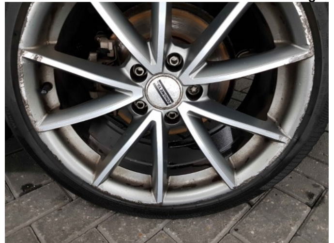
5. Velg achter - links