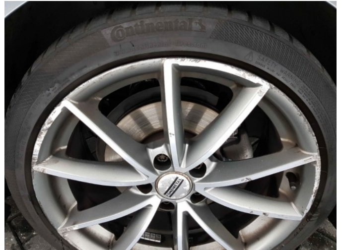
5. Velg achter - links