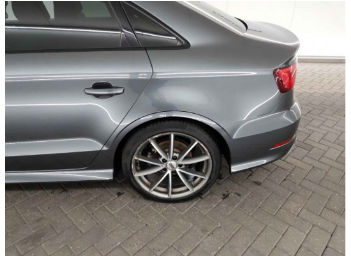
5. Velg achter - links