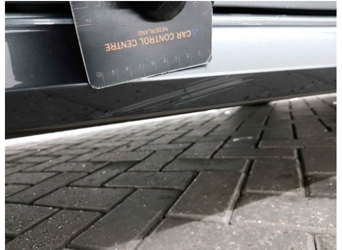
3. Dorpel - rechts