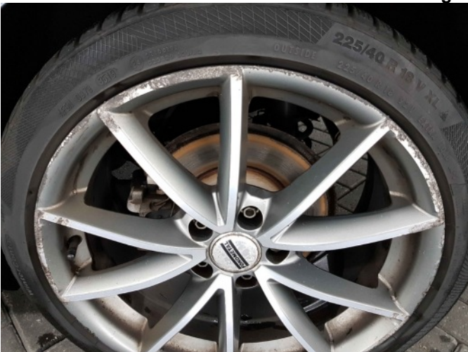
5. Velg achter - links