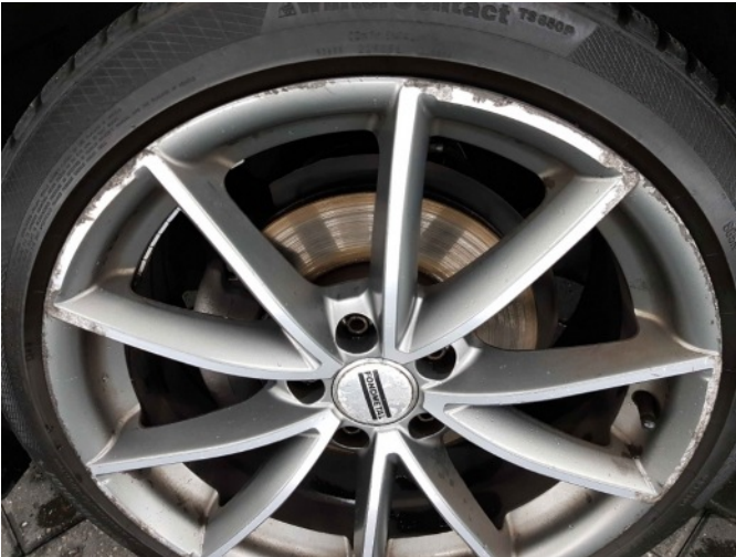
5. Velg achter - links