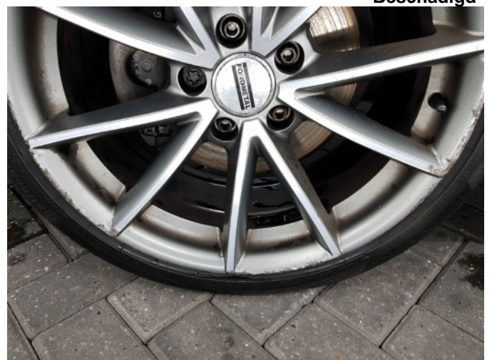
5. Velg achter - links