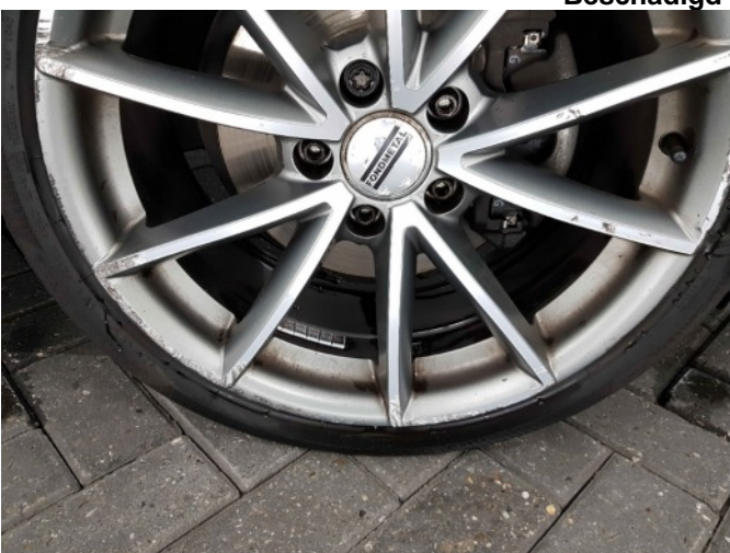
5. Velg achter - links