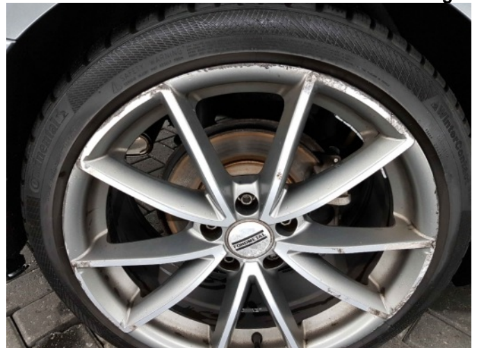
5. Velg achter - links