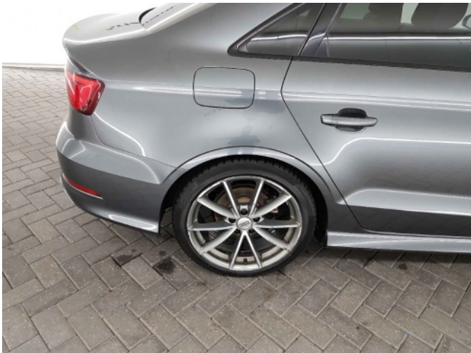
5. Velg achter - links