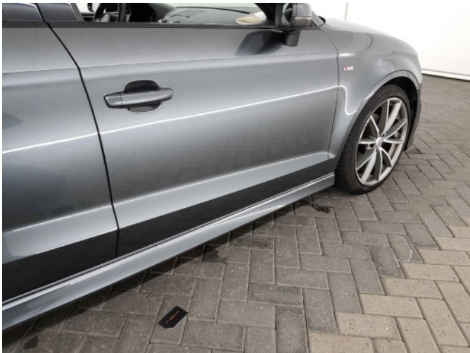
3. Dorpel - rechts