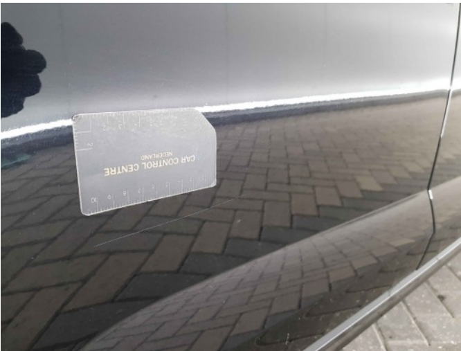
1. Portier achter - rechts