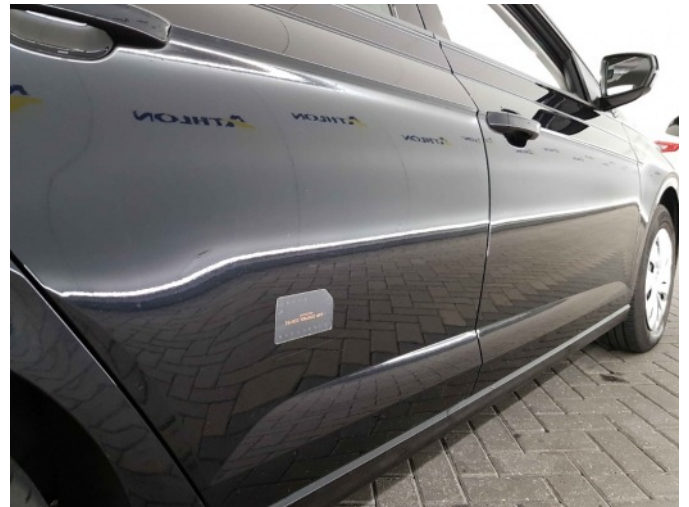
1. Portier achter - rechts