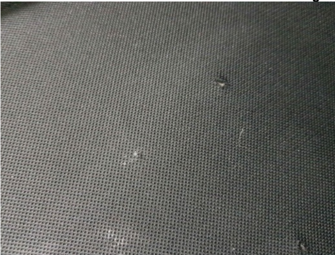
1. LV stoel