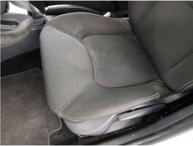
1. LV stoel