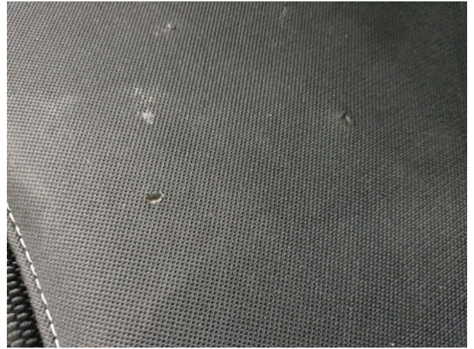
1. LV stoel