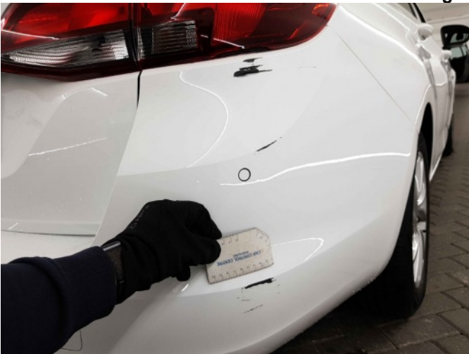
2. Achterlicht rechts