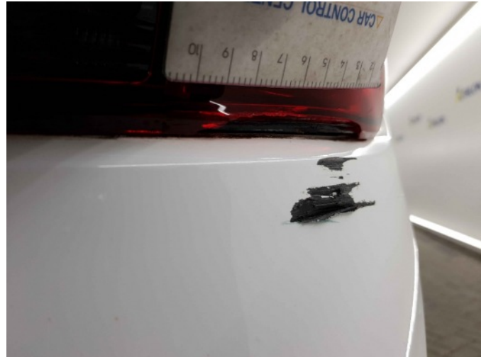
2. Achterlicht rechts