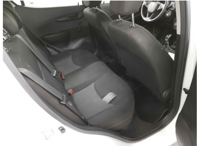
4. Stoel - achter - rechts: zitting