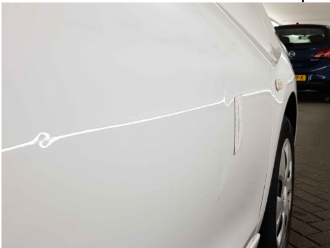
2. Portier voor - rechts