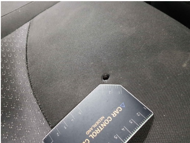
4. Stoel - achter - rechts: zitting