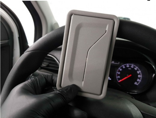
1. lv zonneklep