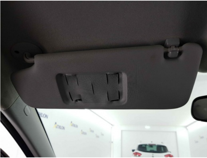
1. lv zonneklep