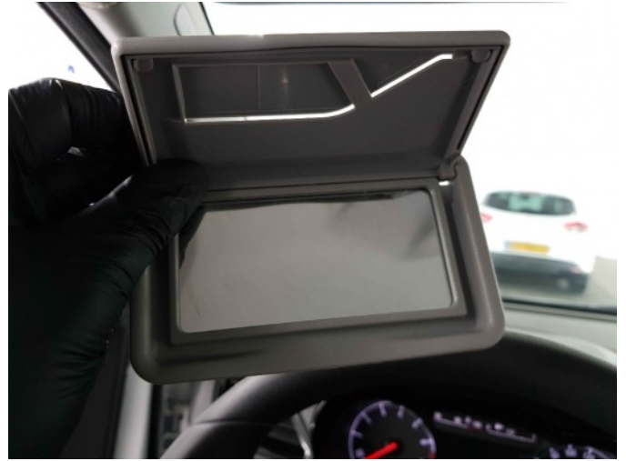
1. lv zonneklep