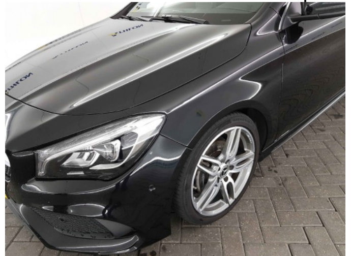
4. Slecht herstel