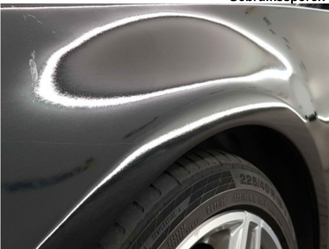
4. Slecht herstel