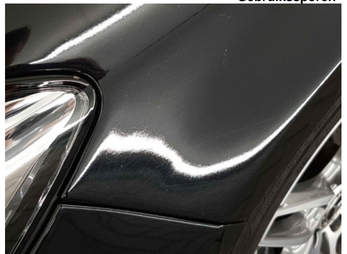
4. Slecht herstel