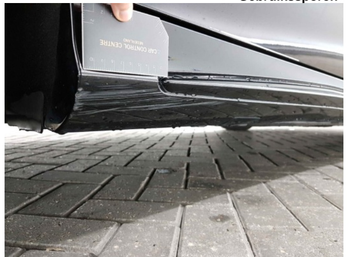
2. Dorpel - rechts