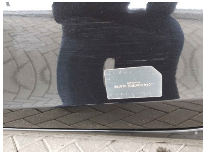
1. Portier voor - links