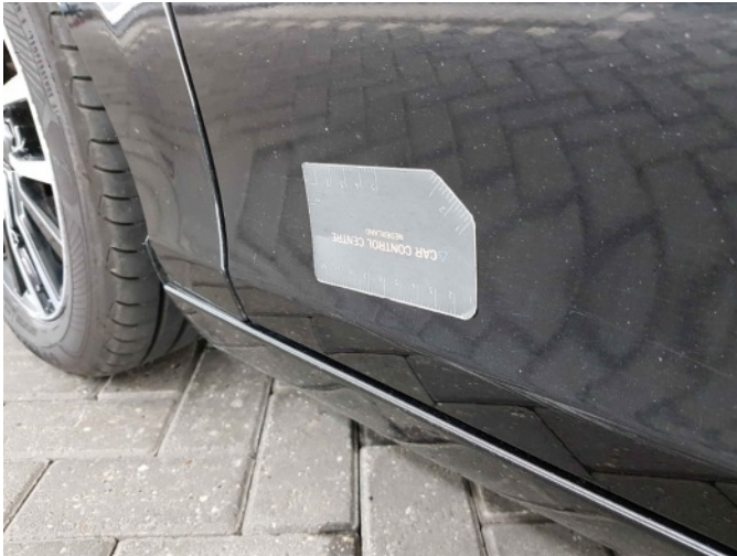
1. Portier voor - links