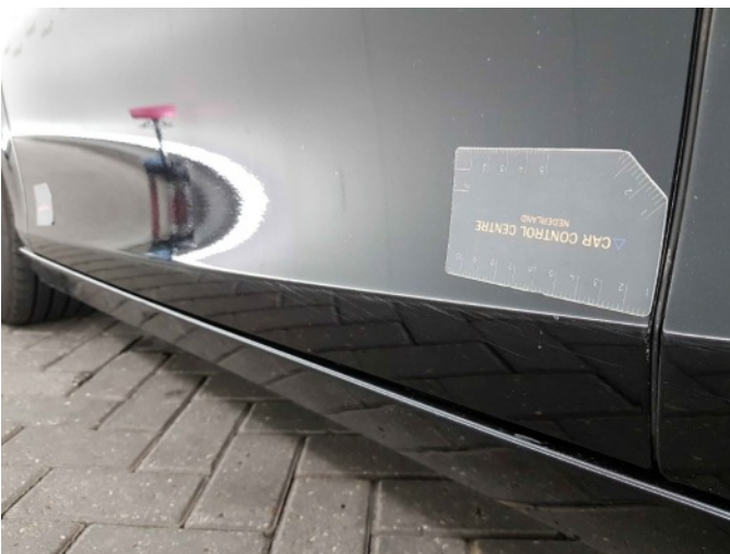
1. Portier voor - links