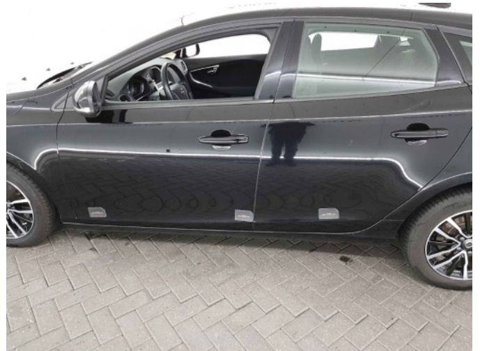
1. Portier voor - links