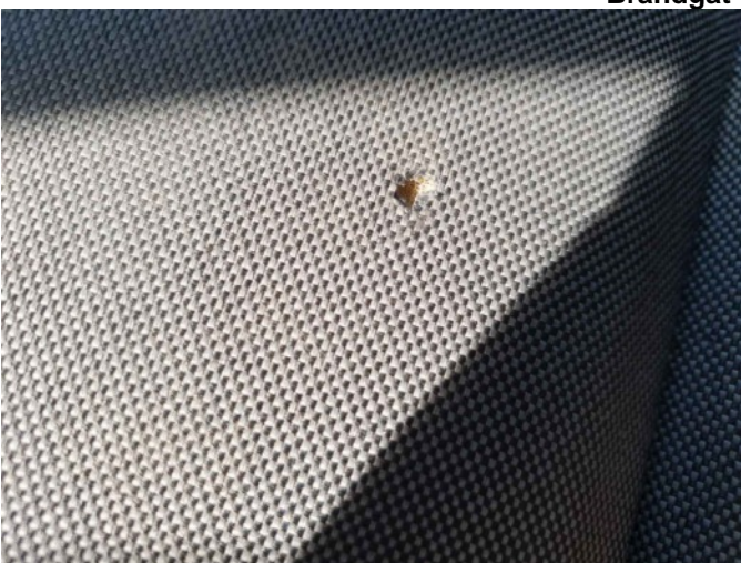
2. LV stoel bekleding