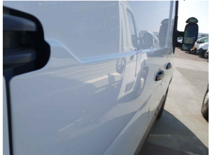
2. Portier achter - rechts