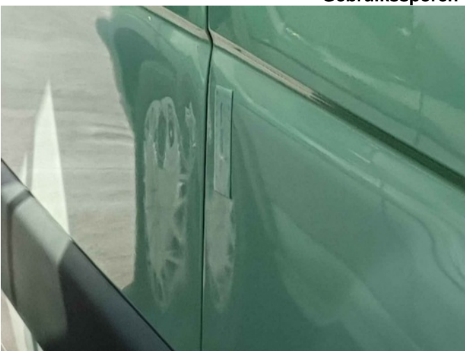
1. Portier achter - links