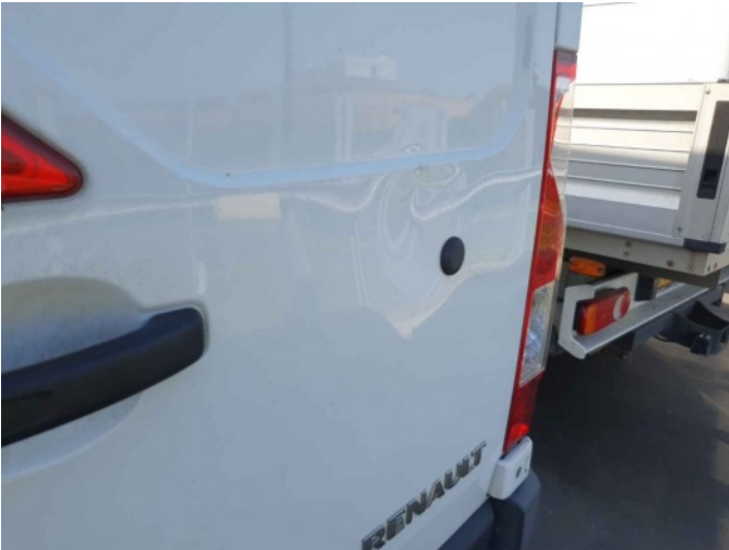
3. RA portier