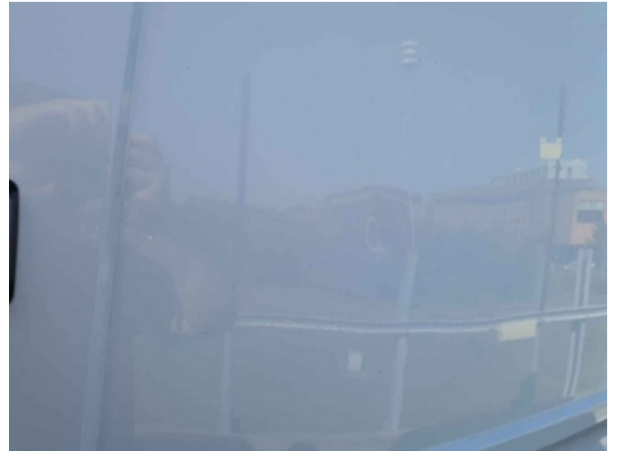
3. RA portier