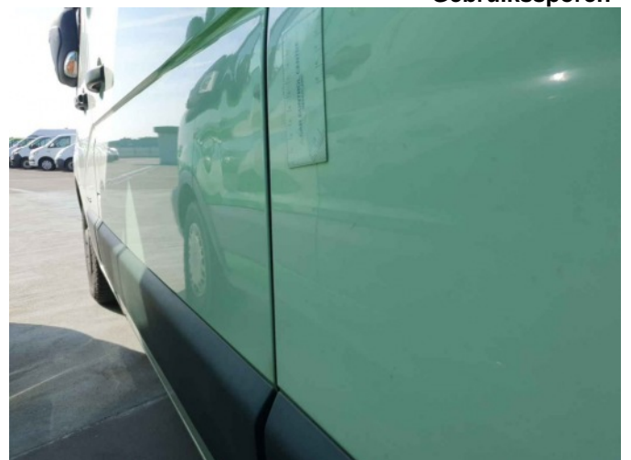
1. Portier achter - links