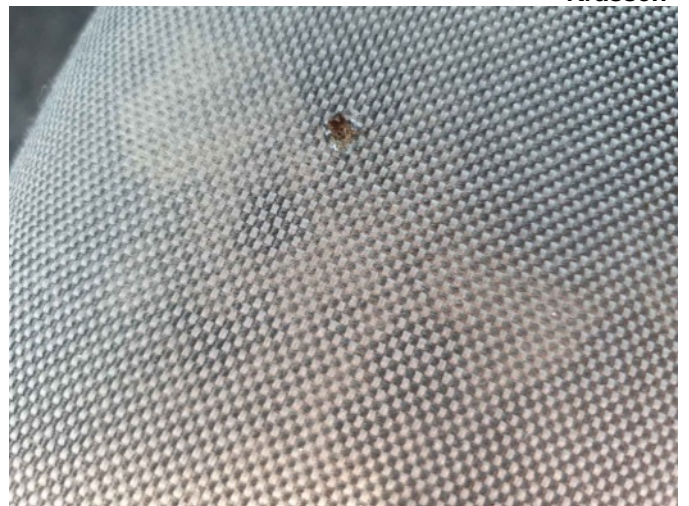
2. LV stoel bekleding