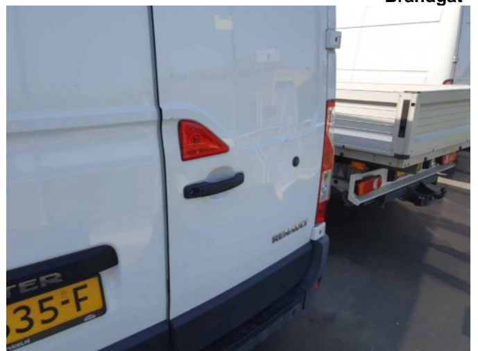
3. RA portier