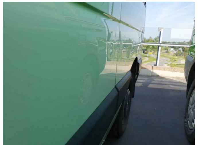
1. Portier achter - links