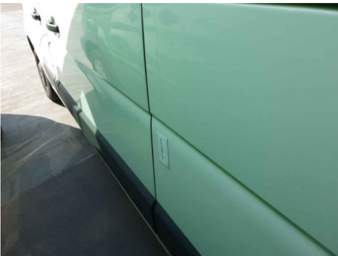
1. Portier achter - links