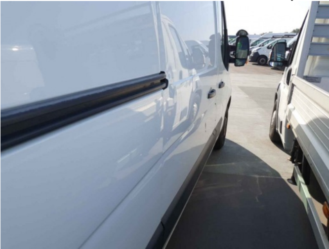
2. Portier achter - rechts