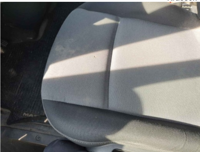
2. LV stoel bekleding