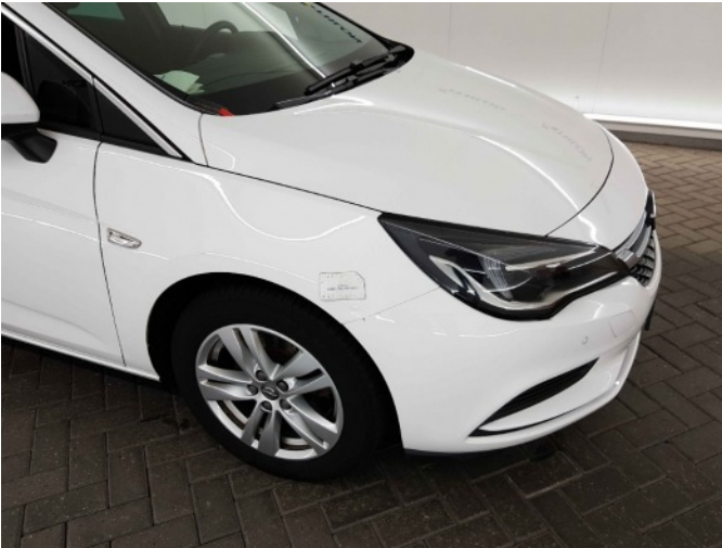
1. Spatbord voor- rechts