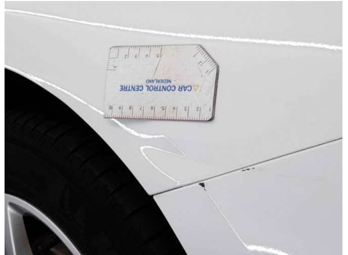
1. Spatbord voor- rechts