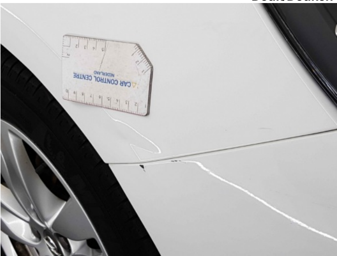
1. Spatbord voor- rechts