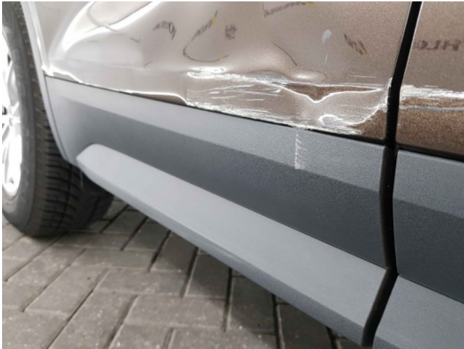
3. Portier achter - rechts