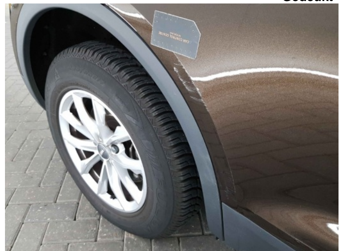
3. Portier achter - rechts