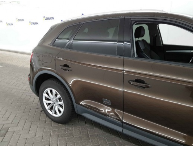
3. Portier achter - rechts