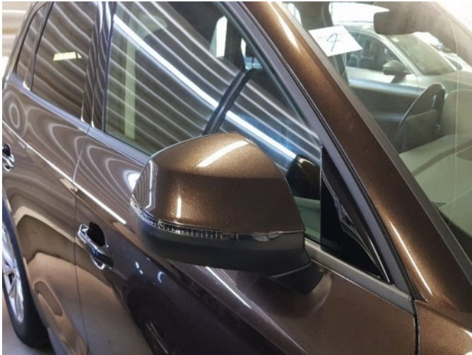
5. Buitenspiegel - rechts