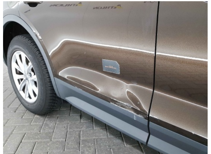
3. Portier achter - rechts