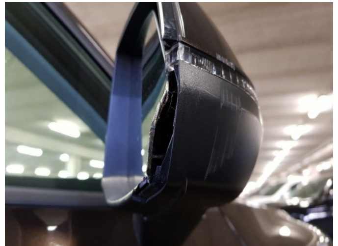
5. Buitenspiegel - rechts