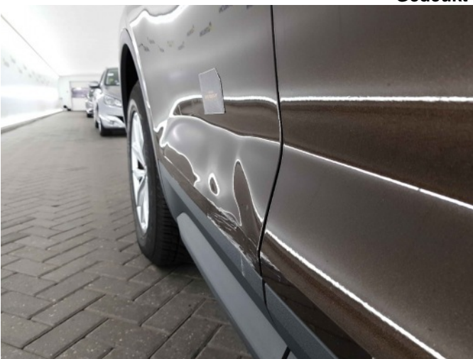
3. Portier achter - rechts