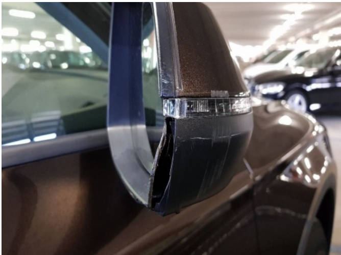
5. Buitenspiegel - rechts