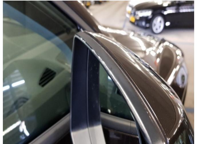
5. Buitenspiegel - rechts