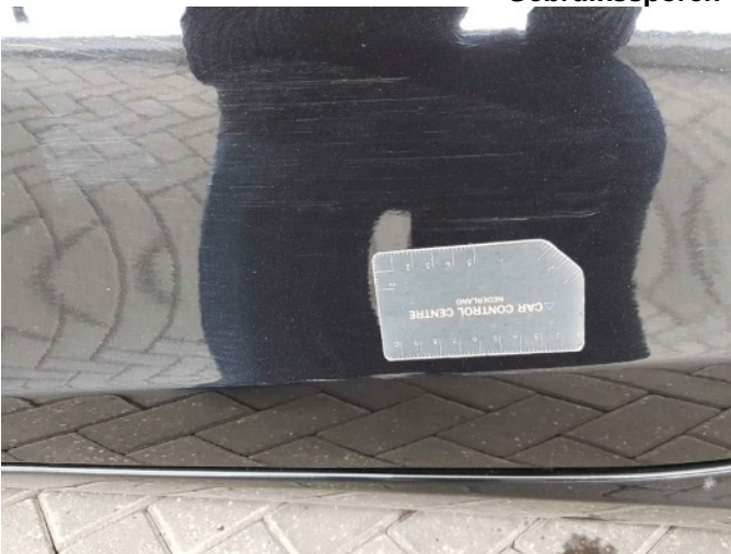
1. Portier voor - links