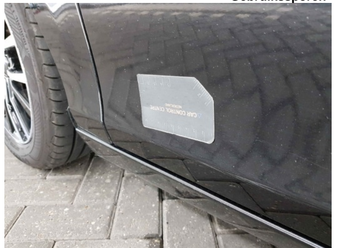
1. Portier voor - links