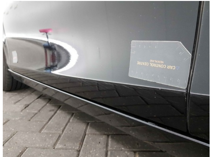
1. Portier voor - links