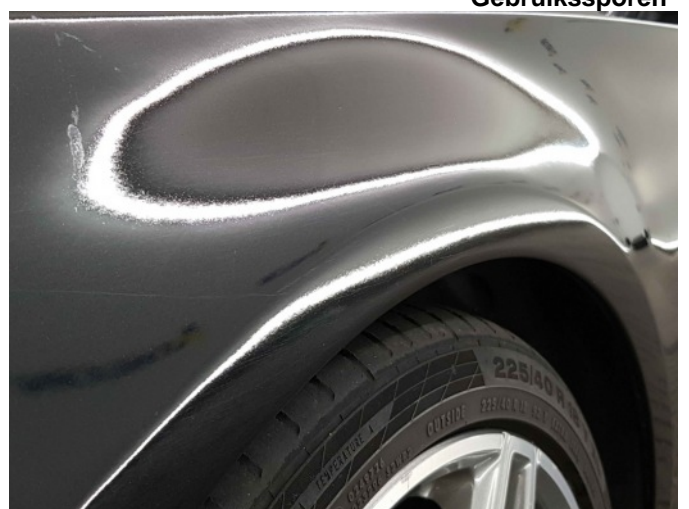
4. Slecht herstel