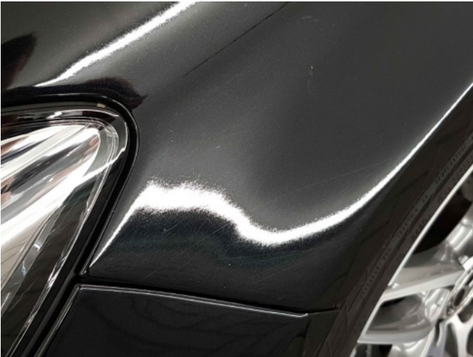
4. Slecht herstel