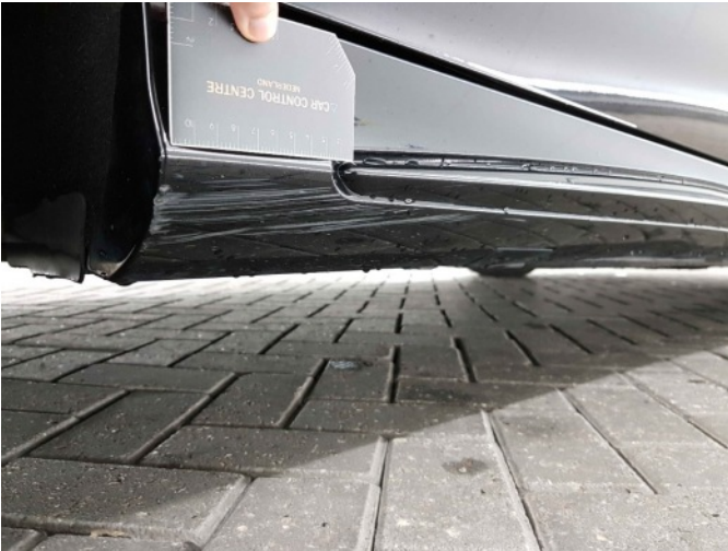
2. Dorpel - rechts