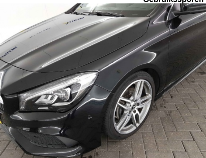
4. Slecht herstel