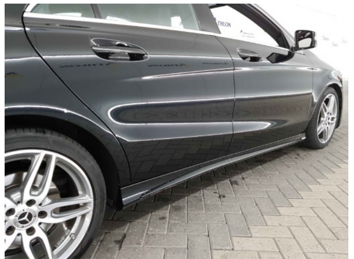
2. Dorpel - rechts