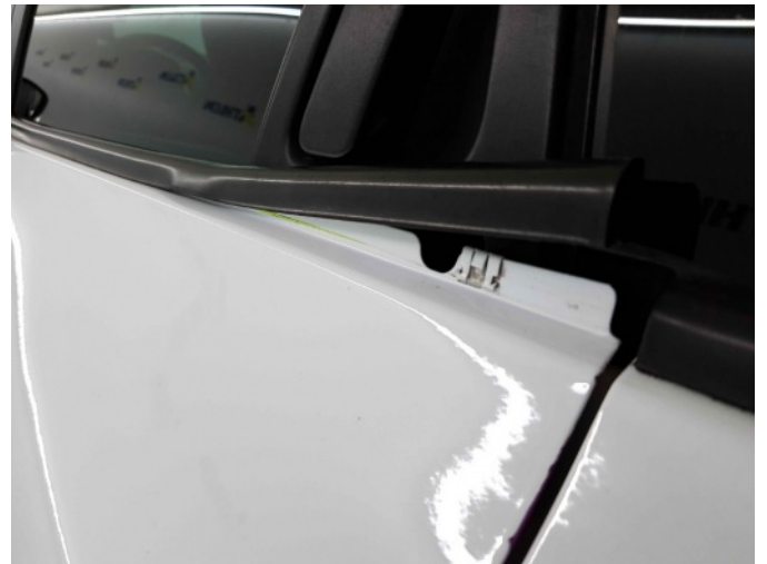
1. la portier raamlijst