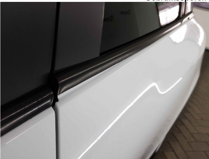
1. la portier raamlijst