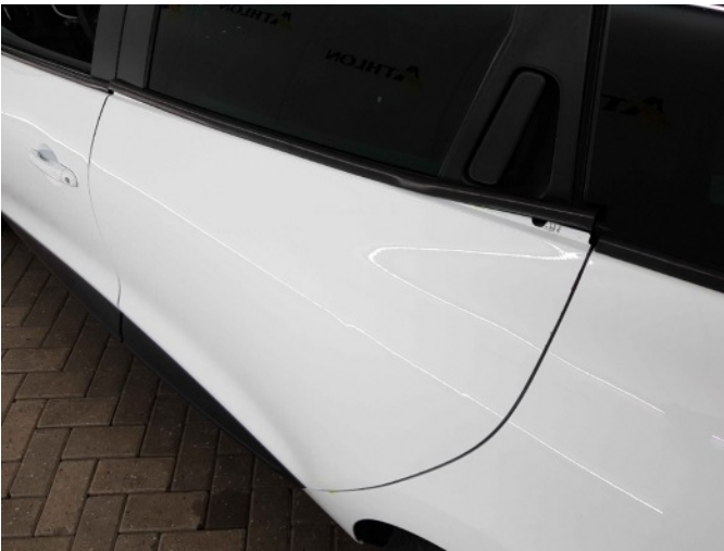
1. la portier raamlijst