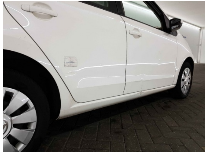
3. Portier voor - rechts