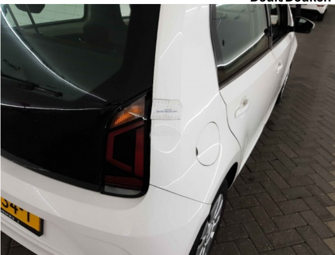
2. Zijwand - achter - rechts