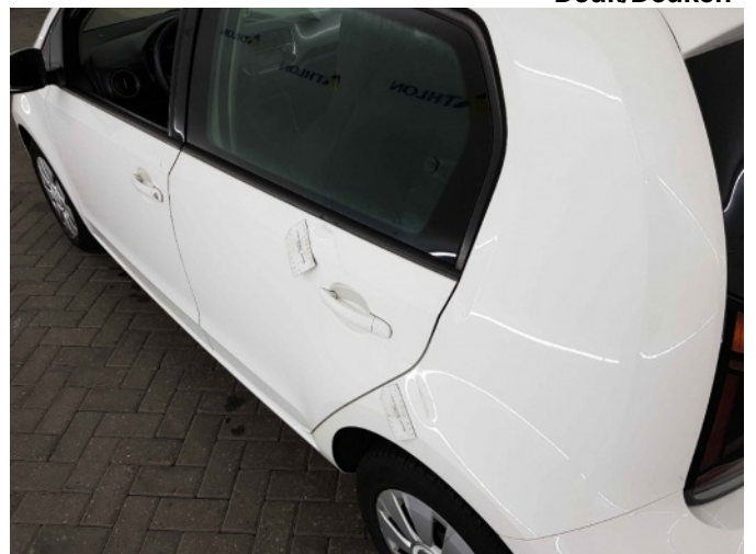
4. Zijwand - achter - Links