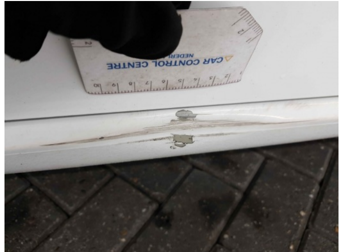
3. Portier voor - rechts