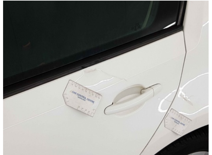
4. Zijwand - achter - Links