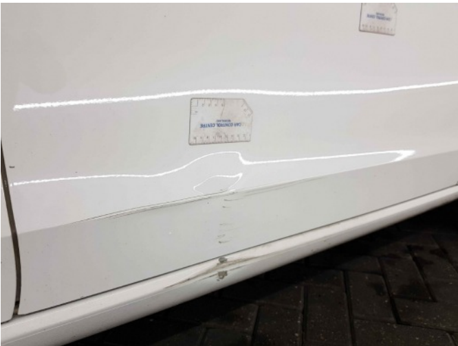
3. Portier voor - rechts