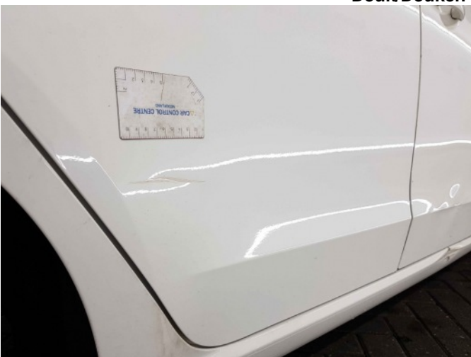
3. Portier voor - rechts