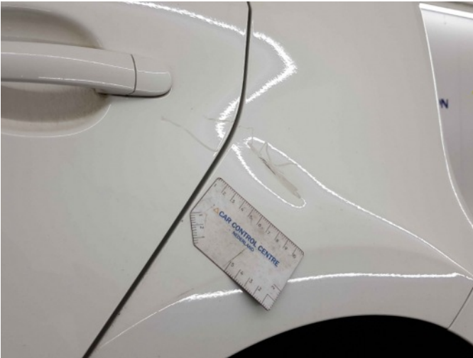
4. Zijwand - achter - Links