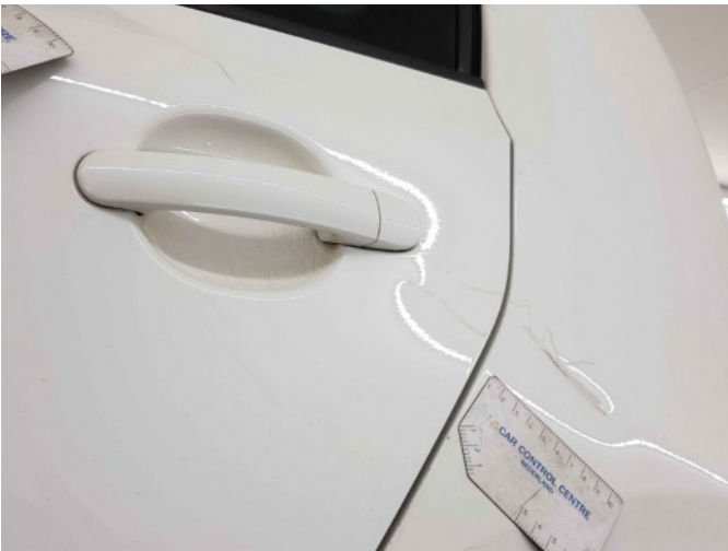
4. Zijwand - achter - Links