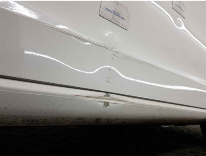
3. Portier voor - rechts