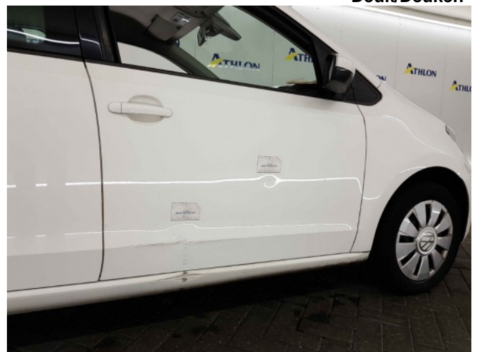
3. Portier voor - rechts