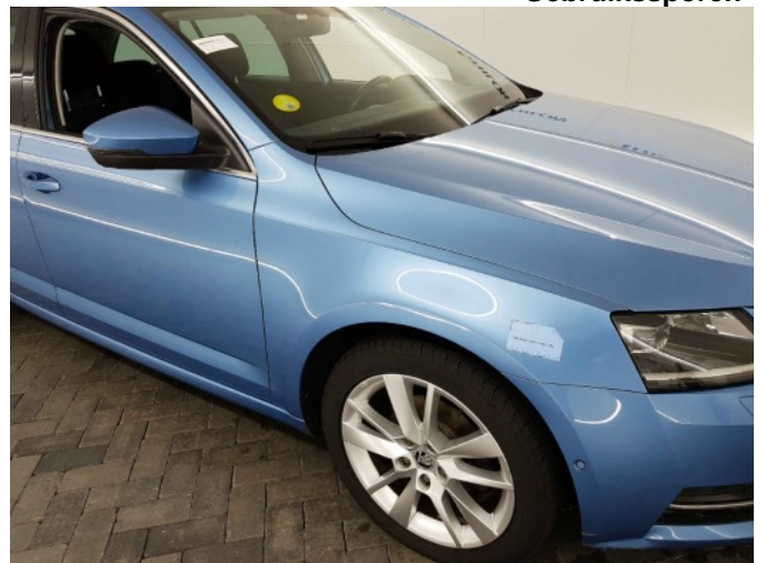
2. Spatbord voor- rechts