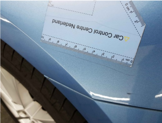
2. Spatbord voor- rechts