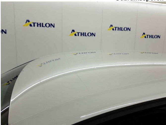
1. Dak 50x20mm, MK 7x20mm