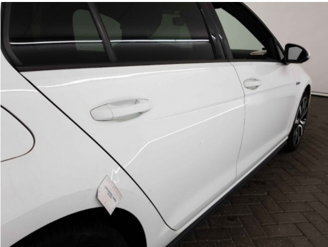
3. Zijwand - achter - rechts