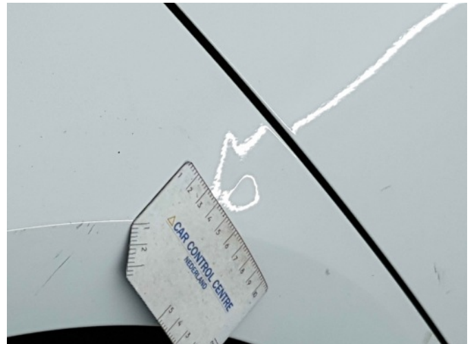
3. Zijwand - achter - rechts