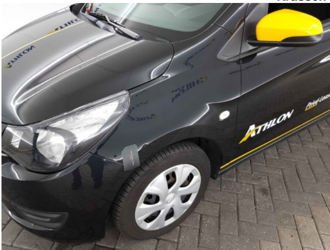
2. Spatbord voor- links