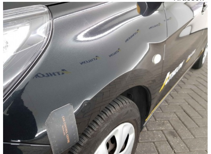
2. Spatbord voor- links