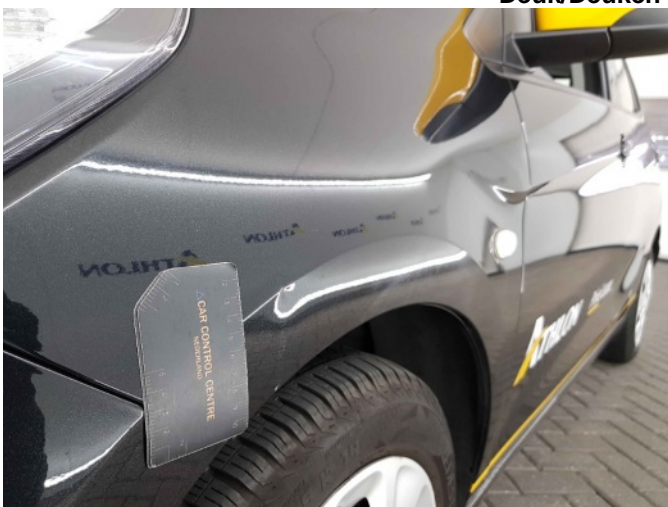
2. Spatbord voor- links