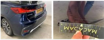
Bumper V, Kras(sen), Herstellen en spuiten (compleet)