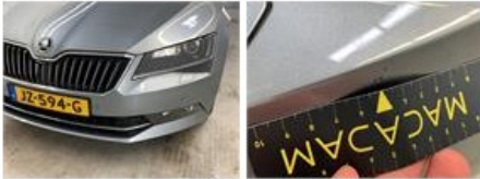
Bumper A, Kras(sen), Herstellen en spuiten (compleet)