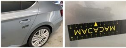
Bumper V, Steenslag, Herstellen en spuiten (compleet)