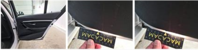
Deur V L, Kras(sen), Herstellen en spuiten (compleet)