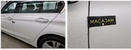
Deurbekleding A R, Kras(sen), Vervangen