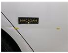
Deur A L, Kras(sen), Herstellen en spuiten (compleet)