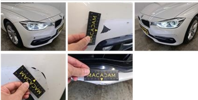
Motorcap, Duk(en), Herstellen en spuiten (compleet)