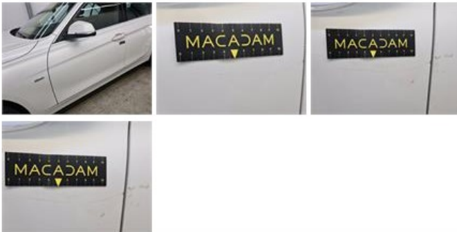
Carrosserie, Lakdiktemeting, Aanvaardbaar