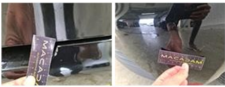
Onderhoud, Onderhoud, Uitvoeren