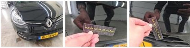
Scherf A L, Kras(sen), Herstellen en spuiten (compleet)