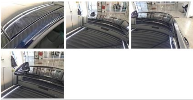
Scherf A L, Deuk(en) en kras(sen), Herstellen en spuiten (compleet)