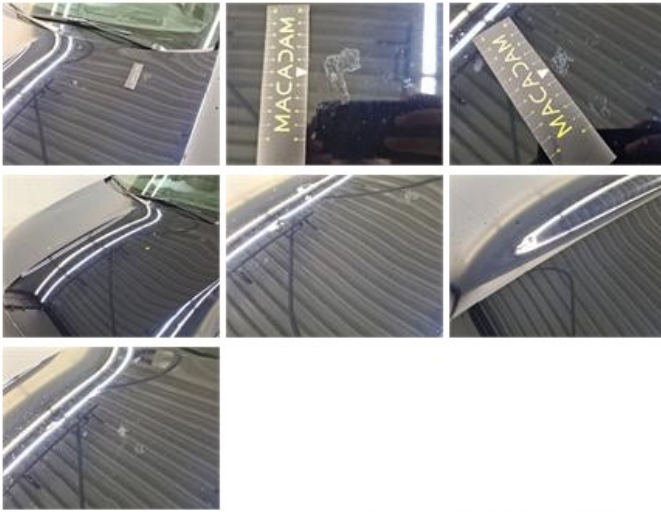
Scherf V L, Chemische schade, Herstellen en spuiten (compleet)