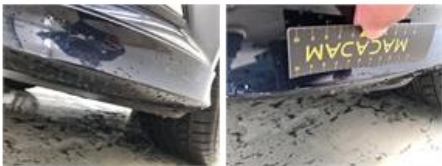
Bumper A, Deuk(en) en kras(sen), Herstellen en spuiten (compleet)