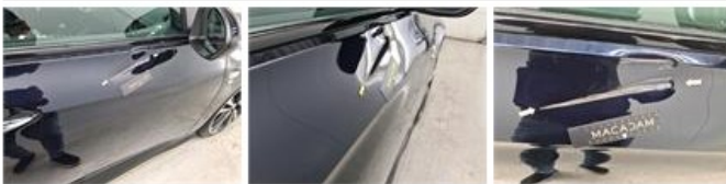
Deur A L, Deuk(en) en kras(sen), Herstellen en spuiten (compleet)