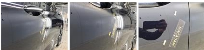
Deur V L, Deuk(en) en kras(sen), Herstellen en spuiten (compleet)