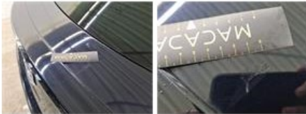
Deur V R, Deuk(en) en kras(sen), Herstellen en spuiten (compleet)