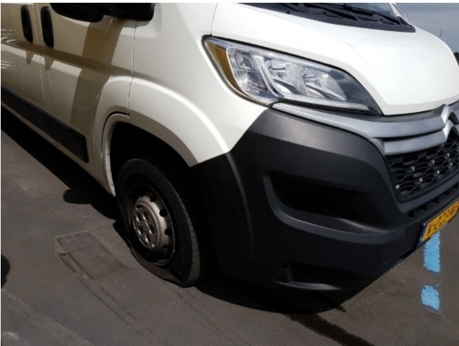
1. Lekke band