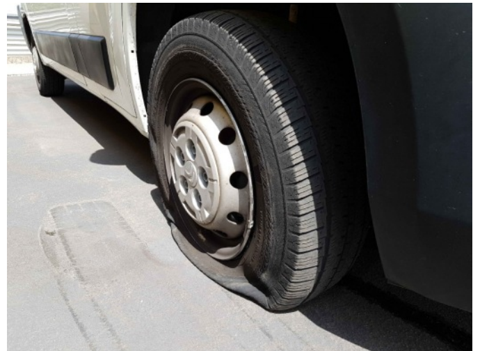
1. Lekke band